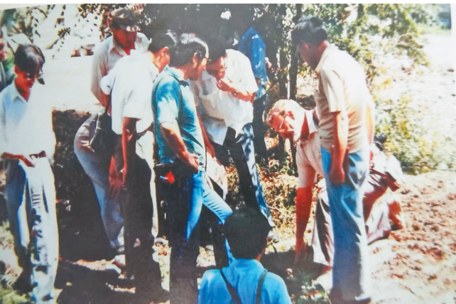
20世纪80年代末考古队员们在发掘现场。

从观景台上下,我们又坐上了环绕在四周的红色小火车,缓缓地穿行在茫茫稻海中。与俯瞰的视角又有不同,置身于稻田画旁,就如同进入了“稻梦空间”,清风吹过,似有一股稻香飘来,在这暑气四溢的盛夏光年,我们仿佛穿越进入了深远的时空里。