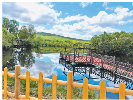
溪畔静静的白桦林。

白桦树,最高可达20多米,皮肤像纸一样光滑、洁白。它喜爱阳光,生命力极强,一场大火过后,历经劫难的它会最先挺直腰杆。它从不讲客观条件,默默地奉献,春风一吹,还没有长出叶子,它就开花了,为大自然送去芬芳。它不张扬,无数果实默默地垂挂枝头,乘着秋风远航,在需要它的大地生根发芽。它不讲条件,可单植,可从生,马路边,岩石旁,沼泽间,需要它的地方它就顽强地生长。做什么材料都可以,连皮都可以榨汁榨油,甚至粉身碎骨也不惋惜,为了光明和温暖,它毫无怨言地化为灰烬与青烟。