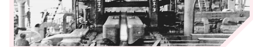
1957年6月29日,825轧机开坯轧制。