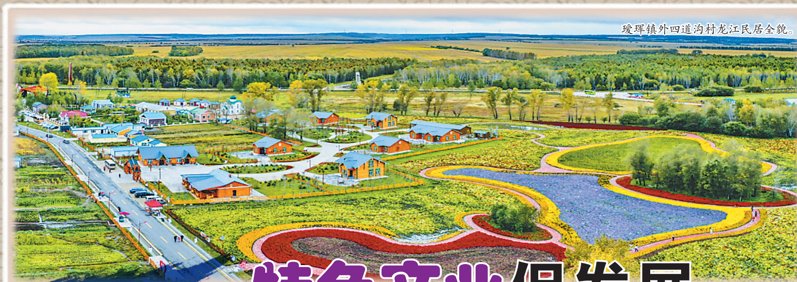
瑛瑛镇外四道沟村龙江民居全貌。

据悉,“文学好书榜”是由中国出版协会文学艺术出版工作委员会下属50余家专业文学出版机构联合推荐的专业榜单。2023年度好书由中国出版协会出版业分会组织,经网络票选、专家终审两个环节,一共评选出20本2023年度好书,其中长篇小说10部,小说集3部,剧本1部,散文/非虚构/纪实文学6部;莫言、阿来、贾平凹、胡学文、毕飞宇、徐鲁等著名作家的作品入榜。