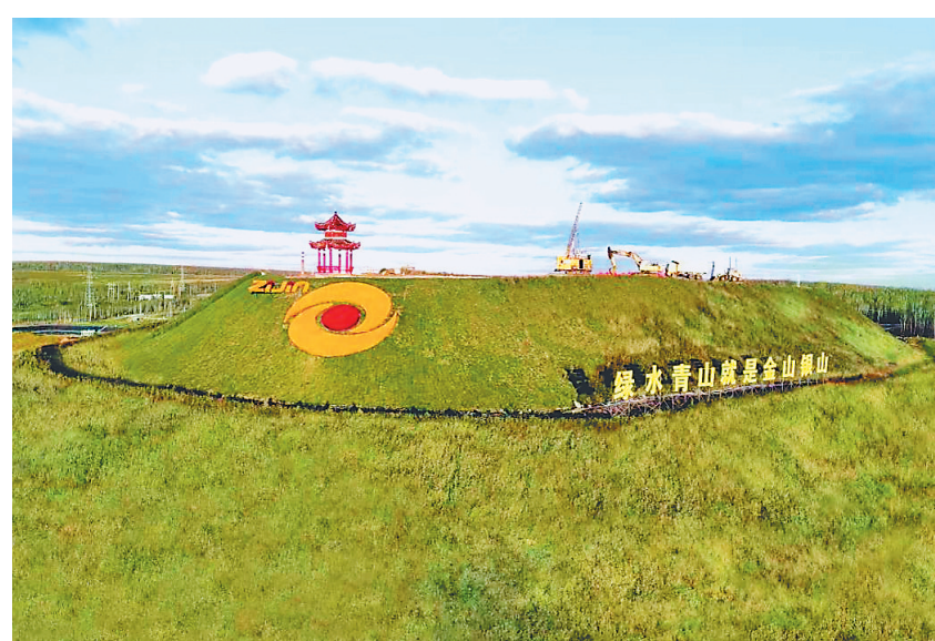
多宝山矿区生态修复新貌。

自2023年启动至今,黑河市已通过核验收收的历史遗留矿山修复治理总面积为2459.70公顷,目前正在开展约800公顷生态修复评估、认定和验收,预计9月底前完成,累计将完成约3200公顷。届时黑河市将提前超额完成到2025年历史遗留矿山生态修复治理目标任务。