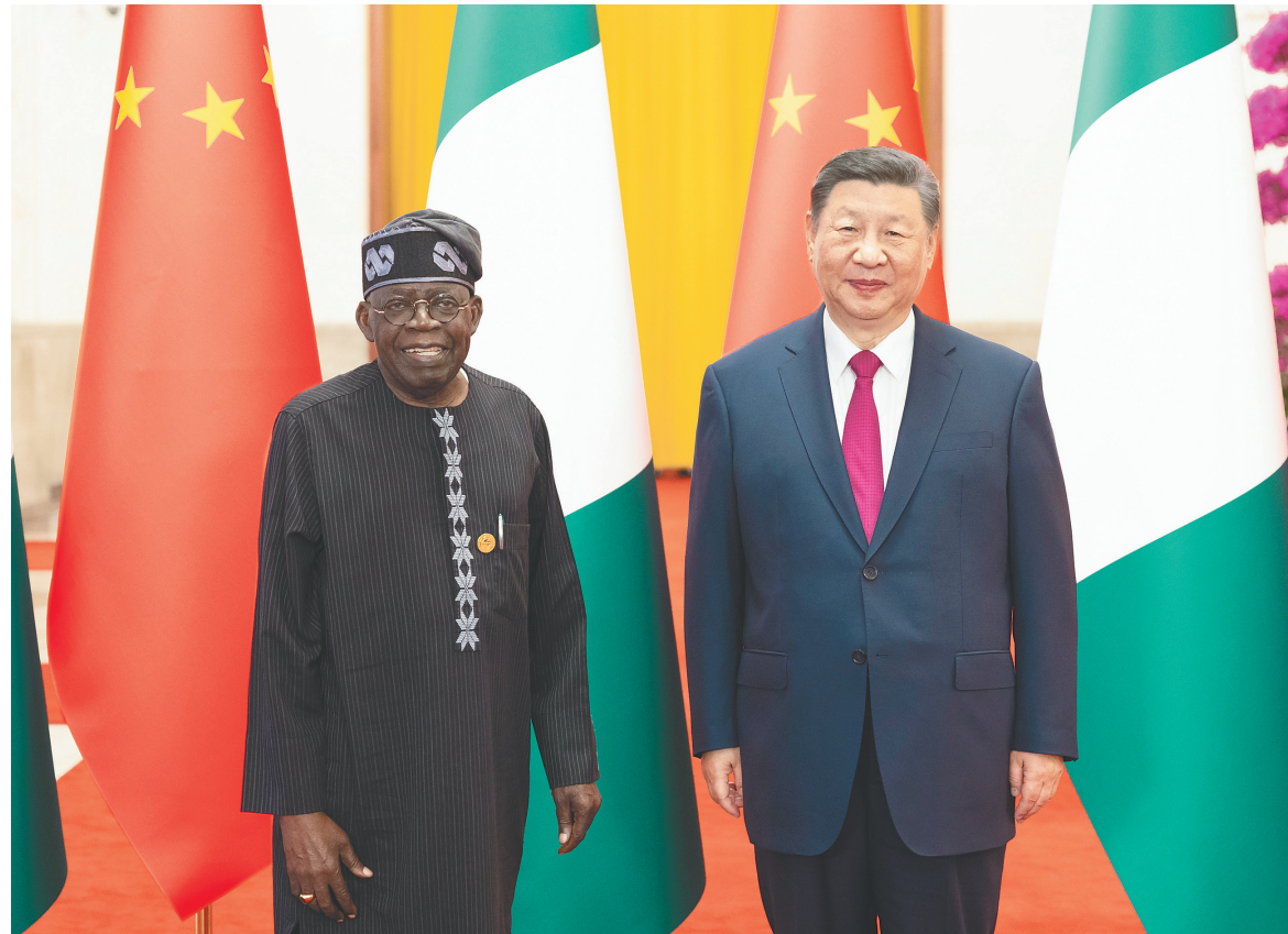
九月三日下午，国家主席习近平在北京人民大会堂同来华出席中非合作论坛北京峰会并进行国事访问的尼日利亚总统提努布举行会谈。