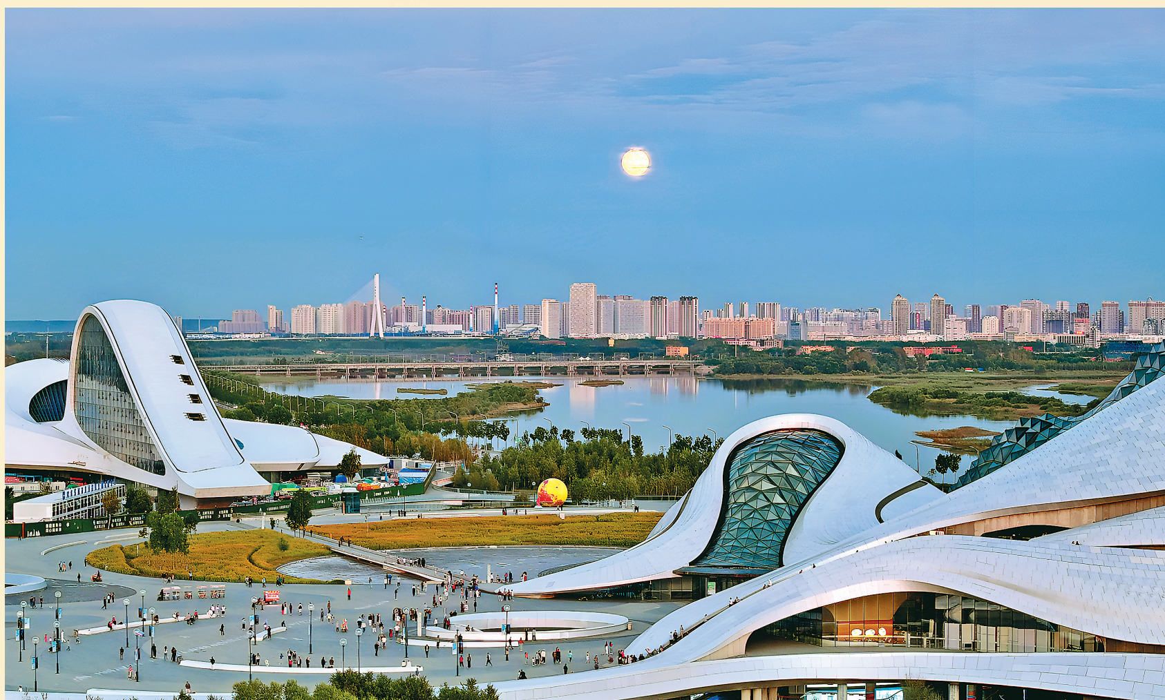
17日，松花江畔的哈尔滨大剧院，伴随着天边逐渐淡去的晚霞，一轮明月升上夜空，洒下漫天清辉。