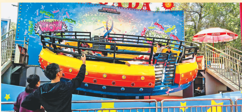
17日，在哈尔滨太阳岛风景区笨熊乐园内，大人和孩子的欢声笑语响彻整个乐园。

17日，携程发布2024年中秋假期旅游总结。总结显示，除了团聚之外，许多家庭和选择选择在中秋假期奔赴旅途，感受秋天的自然风光。我省热门景区分别是哈药六版画博物馆、东北虎林园、扎龙生态旅游区、镜泊湖风景区、伏尔加庄园。而哈尔滨热门景区分别是哈药六版画博物馆、东北虎林园、伏尔加庄园、哈尔滨融创乐园、帽儿山风景区，旅游订单对比端午增长7%，入境旅游订单对比端午增长24%。飞猪数据显示，今年中秋假期，哈尔滨、齐齐哈尔、伊春、牡丹江、大庆等是我省旅游热门城市，其中大兴安岭酒店预订热度较2019年增长124%。今年中秋假期，乘坐火车游黑龙江的游客占比近四成。北京、山东、辽宁、浙江、上海等是中秋假期前往我省旅游的热门客源地。