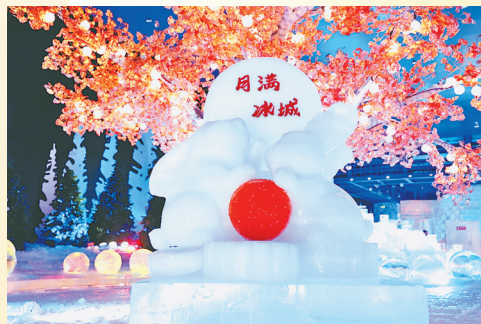
17日，走进哈尔滨冰雪大世界梦幻冰雪馆内，中秋主题冰雕“玉兔望月”映入眼帘。“玉兔望月”由一轮明月、两只惟妙惟肖的望月玉兔和一枚月饼组成。圆月上雕刻着“月满冰城”，月饼上刻有“花好月圆”。整座冰雕取“天上月圆，人间庆团圆”之意。