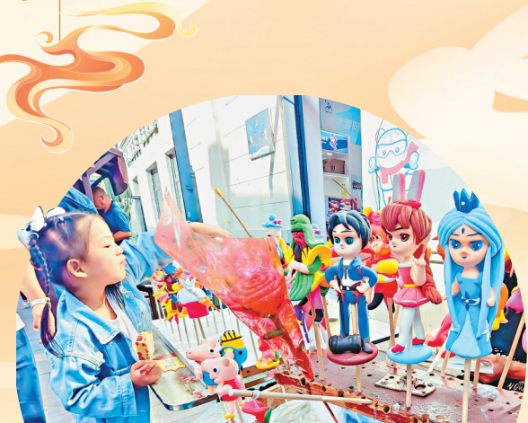
17日，哈尔滨市道外区中华巴洛克历史文化街区，孩子们对糖画、面人等手工艺品的制作过程产生浓厚兴趣，守在摊位前久久不愿离去。