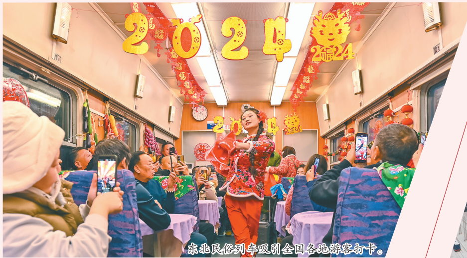
东北民俗列车吸引全国各地游客打卡。

截至目前,哈尔滨局集团公司营业里程达8493公里,其中高铁运营里程达1400公里,电气化和复线里程分别提高429.5公里和369.2公里,越织越密的铁路网为龙江的全面振兴全方位振兴铺设出钢铁跑道。