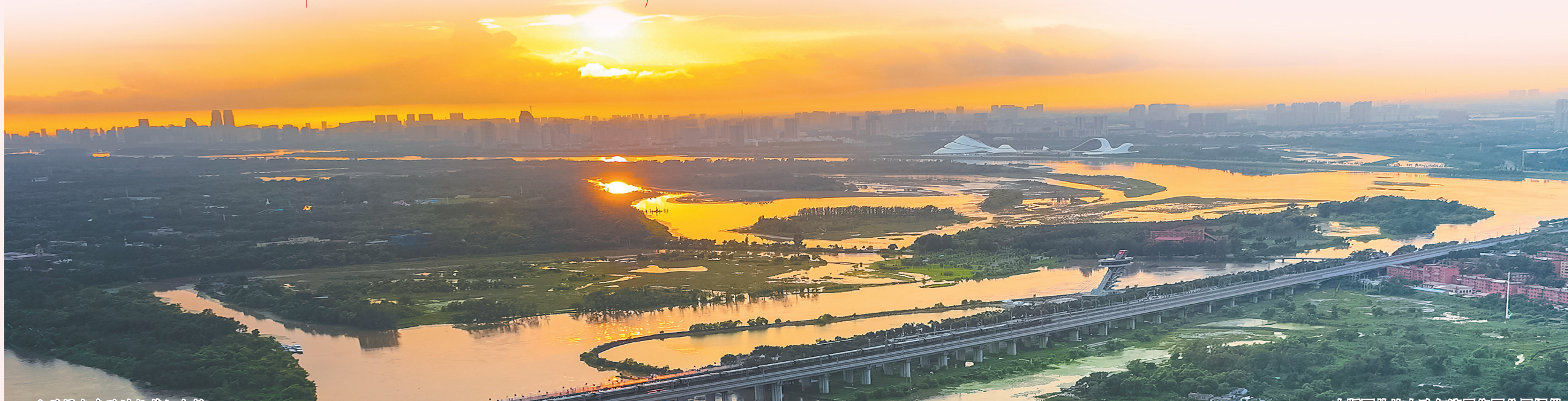
公益慢火车驶过松花江大桥。

今年以来,中欧班列“东通道”满洲里、绥芬河、同江铁路口岸累计进出口运量2404万吨,同比增长11.5%,创历史同期新高,为畅通国内国际双循环,稳定产业链供应链发挥着重要作用。