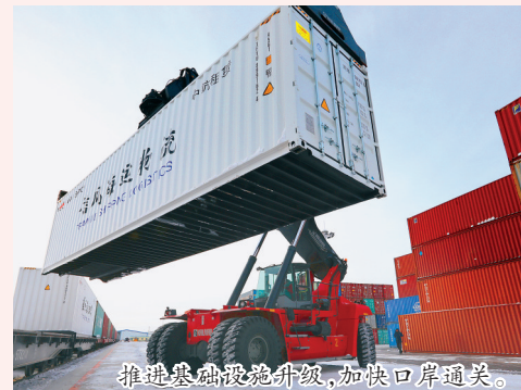
推进基础设施升级,加快口岸通关。

哈尔滨局集团公司着力提升口岸站通关能力,加强基础设施升级,2021年起,绥芬河、满洲里两大口岸新建集装箱场,换装能力提升一倍以上;2023年7月28日,同江北站开行首趟出境中欧班列,打造对外贸易新通道;今年5月23日,滨绥铁路绥芬河至国境线改造工程正式开工,改建后线路设计时速由55公里提升为120公里,线路通过能力提升一倍以上。今年5月28日,佳木斯至同江铁路扩能改造工程启动,单线变复线,列车通过能力提升三倍。