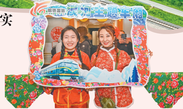
东北民俗旅游列车火爆出圈。

中国铁路哈尔滨局集团有限公司深入贯彻落实习近平总书记在新时期推动东北全面振兴座谈会上重要讲话精神,五年来,坚持以服务龙江经济发展为己任,加快向现代化物流企业转型,全面提升铁路运输产品供给质量,创新客货运产品和便民利民服务举措,持续完善路网结构,优化客货运输服务,降低物流成本,助推“一带一路”建设,畅通对外贸易通道,为我省全面振兴全方位振兴注入新动能。