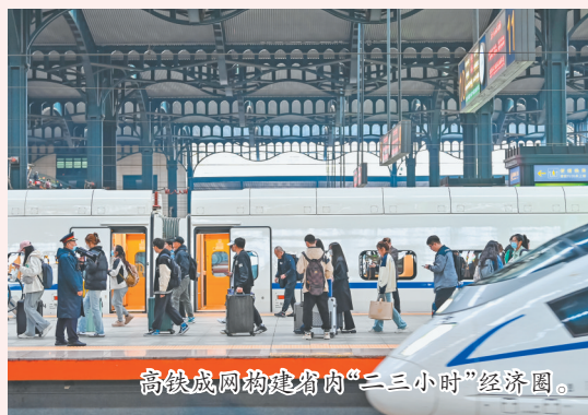
高铁成网构建省内“二小时”经济圈。