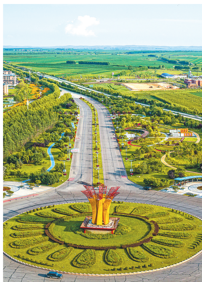
航拍桦南县地标景观“旋叶芳桦”。

桦南县一直广纳天下英才来桦南工作和创业,坚持以城市最高礼遇、最大诚意致敬人才,发放“人才”绿卡,推出安家购房、创新创业、提拔晋升、生活津贴等“政策大礼包”,以“来了就是桦南人”的胸襟聚天下英才,迎八方来客,为广大创业者搭建实现梦想的舞台。