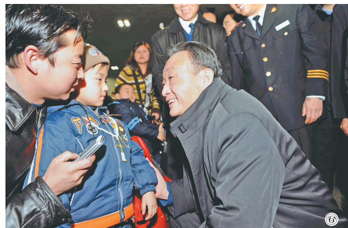
图⑥:2008年2月3日,吴邦国同志在北京西站候车室与旅客交谈。