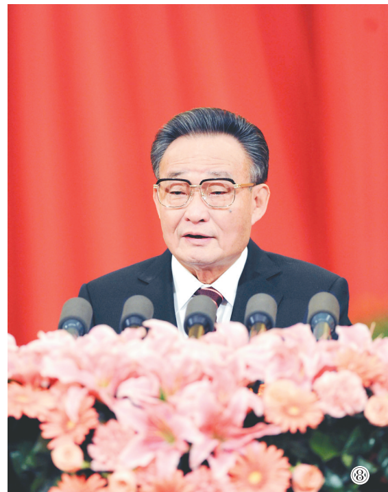
图⑧:二〇一一年三月十日,十一届全国人大四次会议在北京人民大会堂举行第二次全体会议。吴邦国同志作全国人民代表大会常务委员工作报告。