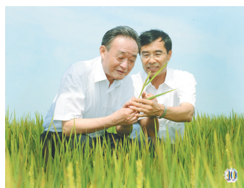
图⑩:2012年7月19日,吴邦国同志在黑龙江农垦建三江管理局二道河农场万亩大地号察看水稻长势。