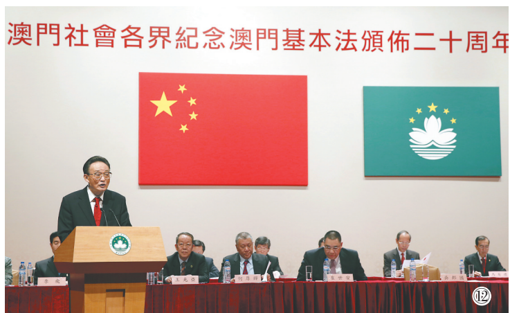
图⑫:2013年2月21日,吴邦国同志在澳门文化中心出席澳门社会各界纪念澳门基本法颁布20周年启动大会并发表讲话。