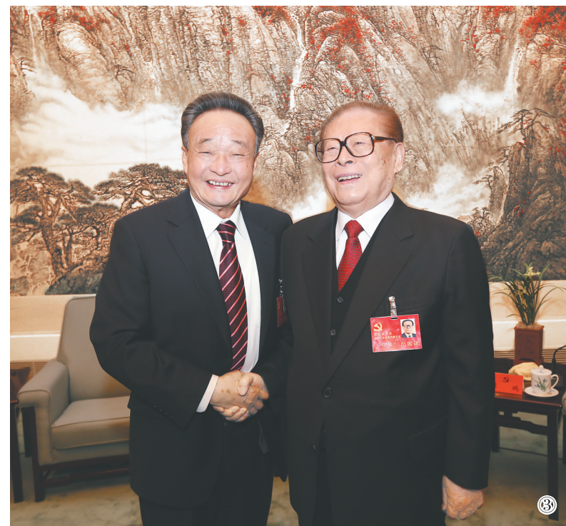
图③:2012年11月14日,中国共产党第十八次全国代表大会在北京闭幕。这是闭幕会前,江泽民同志与吴邦国同志在一起。