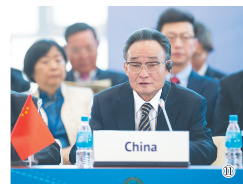
图⑪:2013年1月28日,吴邦国同志在俄罗斯符拉迪沃斯托克出席亚太议会论坛第21届年会,并作题为《坚持和平发展 促进合作共赢》的主旨发言。