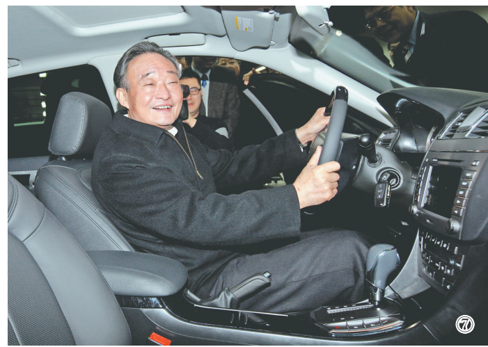
图⑦:2010年1月30日,吴邦国同志在上海汽车集团股份有限公司技术中心察看新能源车。