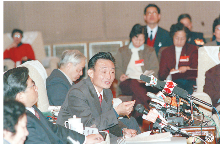
图⑤:1994年3月,时任上海市委书记的吴邦国同志在全国两会上海代表团全团会议上。