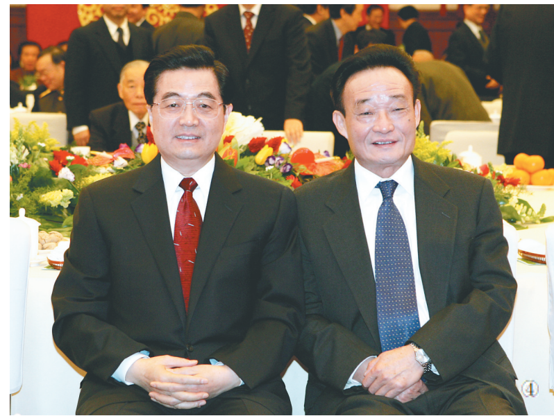
图④:二〇〇五年一月一日,全国政协在北京举行新年茶话会。这是胡锦涛同志与吴邦国同志在一起。