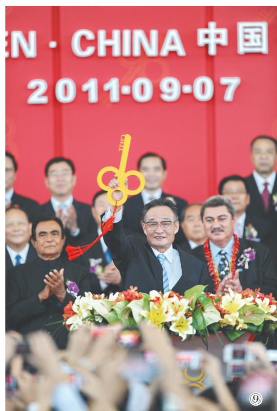
图⑨:二〇一一年九月七日,吴邦国同志在福建厦门出席第十五届中国国际投资贸易洽谈会开幕式。