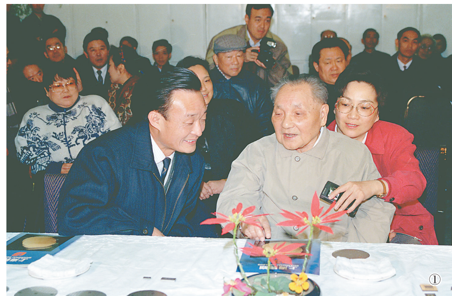
图①:1992年2月10日,邓小平同志在上海贝岭微电子制造有限公司参观时与吴邦国同志交谈。