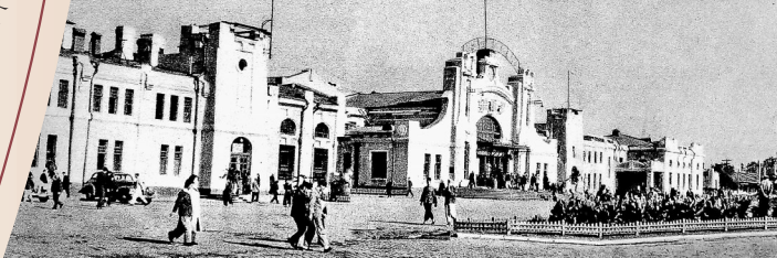
图④:1955年,哈尔滨火车站站舍第一次扩建。