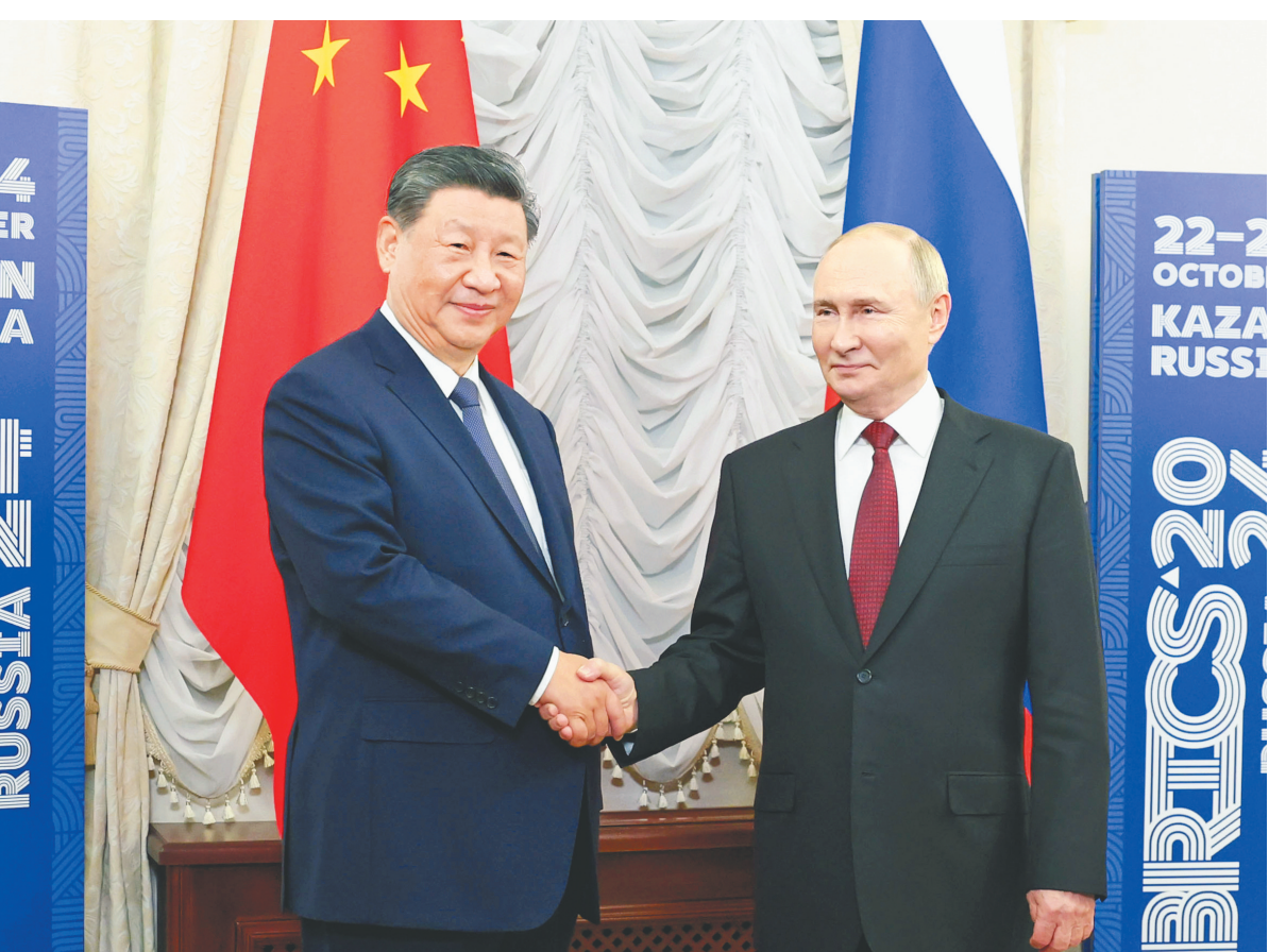
当地时间十月二十二日下午,国家主席习近平在喀山克里姆林宫同俄罗斯总统普京举行会晤。

新华社俄罗斯喀山10月22日电(记者郝薇 黄河)当地时间10月22日下午,国家主席习近平在喀山克里姆林宫同俄罗斯总统普京举行会晤。