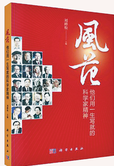
《风范：他们用一生写就的科学家精神》/刘峰松/科学出版社/2024年6月