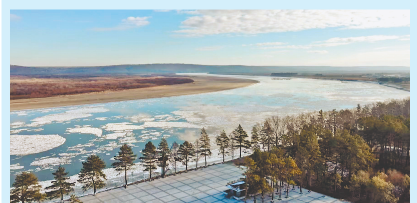
连绵的冰排顺江而下。