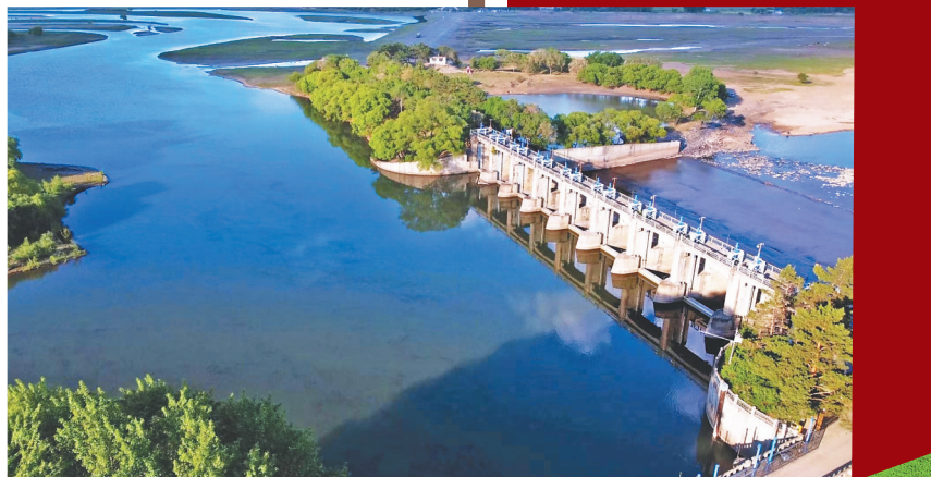
↓查哈阳灌区。

积36.72平方千米,进一步构建完整的侵蚀沟防御体系,有效控制侵蚀沟扩张、改善耕作区及河流生态环境。同时,农场还大力施用有机肥料和微生物肥32.4万亩,不断改善土壤环境、培肥地力。