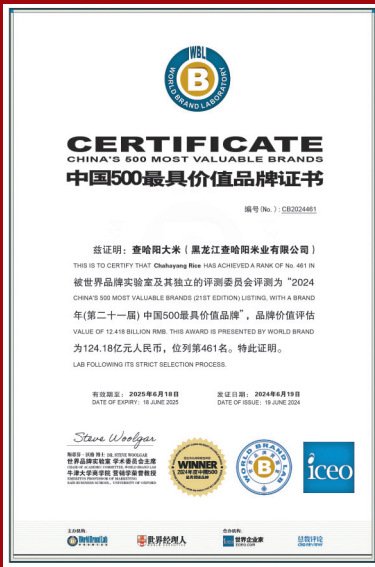
↑品牌价值证书。

查哈阳农场在科技农业的道路上稳步前行,数字化、智能化、信息化等新技术的使用,助力农业发展迈向新台阶。未来,农场将继续加大科技投入,不断探索创新,整体推进农业科技化、数字化、信息化走向实质化应用。