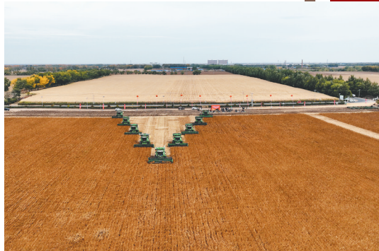
←2024年大豆收获劳动竞赛。

万物土中生,有土斯有粮。在发展绿色农业过程中,农场始终坚持生态优先理念,不断探索黑土保护的新技术、新方法,因地制宜、综合施策,让绿色农业种植发展贯穿农业始终,通过绿色高质高效种植、农药化肥减量增效、水旱田秸秆还田等技术,加快培育土体结构优良、耕层深厚、有机质丰富、养分均衡的土壤,全面提升土壤有机质含量。2024年农场共治理侵蚀沟136条,保护耕地面积达28.56平方千米,控制水土流失面