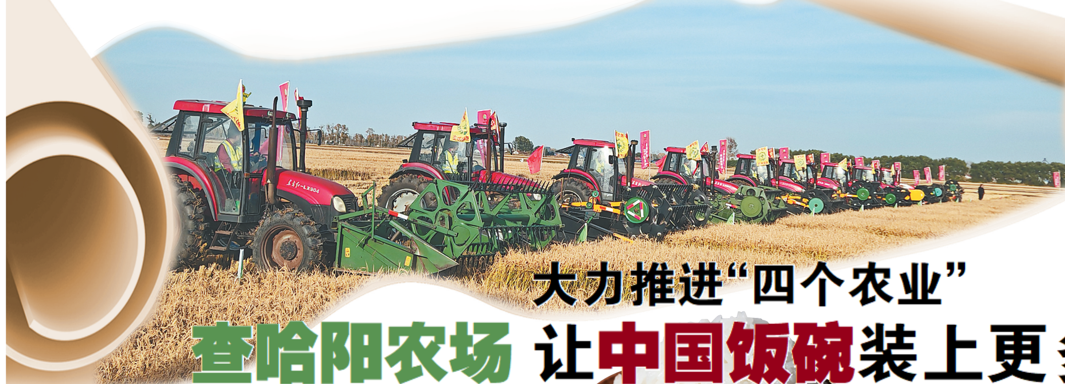
2024年水稻收获劳动竞赛。