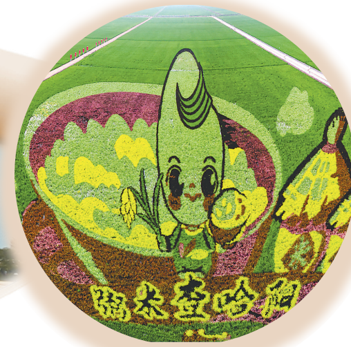
2024年查哈阳稻田画。