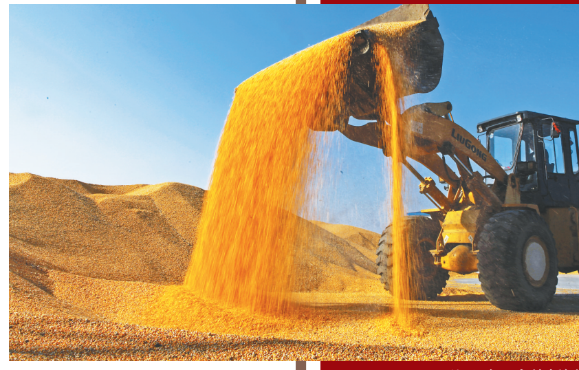
秋粮收获。

随着科技的不断进步,智慧农机正逐渐成为现代农业的新引擎,其高效、精准、智能的特点,极大地提高了农业生产效率,为粮食增产增收助力。今年秋收期间,农场内配有北斗导航和5G信号的国产大马力机车和配有节粮减损装置的机车成为秋收战场的主力军,相比往年,国产智慧农机占比提升至87%。不仅提升了作业效率和产量,也为节粮减损提供了保障。10月13日,农场应用无膜浅埋滴