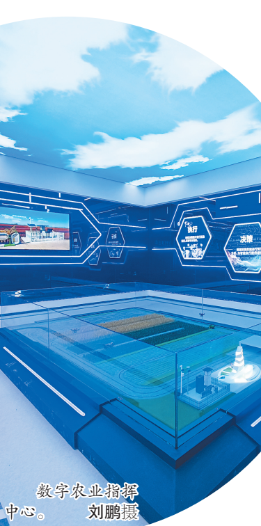
数字农业指挥中心。