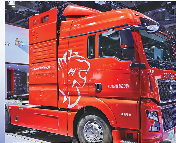
搭载丰华300kW燃料电池系统的49t牵引车

此外,丰田还在积极推动电池回收再利用方面的工作,减少资源浪费。丰田首次在中国展出了Sweep储能系统,该系统能够储存太阳能光伏、风力发电等可再生能源。