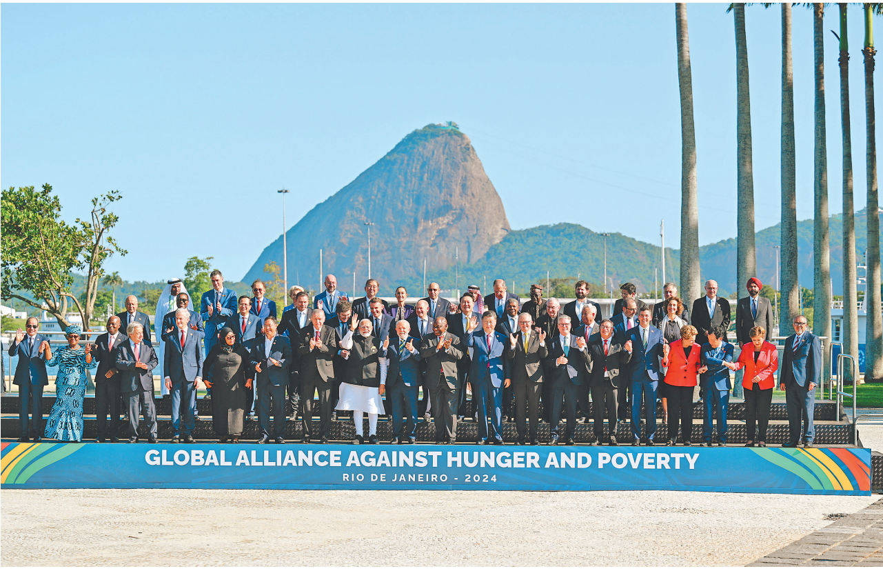
当地时间11月18日上午，国家主席习近平在巴西里约热内卢出席二十国集团领导人第十九次峰会。峰会把“构建公正的世界和可持续发展的星球”作为主题，并决定成立“抗击饥饿与贫困全球联盟”。这是习近平同与会领导人共同参加巴方发起的“抗击饥饿与贫困全球联盟”合影。

新华社里约热内卢11月18日电(记者倪四义 姜岩)当地时间11月18日上午，国家主席习近平在巴西里约热内卢出席二十国集团领导人第十九次峰会。