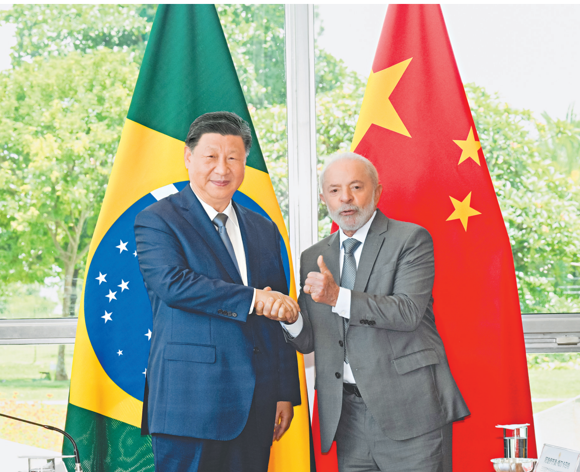
当地时间十一月二十日上午，国家主席习近平在巴西利亚总统官邸黎明宫同巴西总统卢拉举行会谈。

新华社巴西利亚11月20日电(记者倪四义 陈威华)当地时间11月20日上午，国家主席习近平在巴西利亚总统官邸黎明宫同巴西总统卢拉举行会谈。两国元首宣布，将中巴关系定位提升为携手构建更公正世界和更可持续星球的中巴命运共同体。