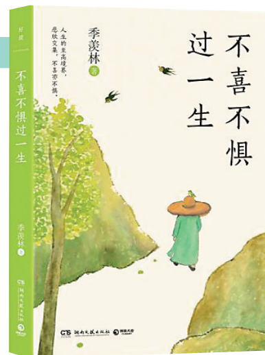
《不喜不惧过一生》/季羨林/湖南文艺出版社/2024年9月

本着这一执念，季羨林一心向国，以非凡的勇气，坦然面对苦难和厄运，凭借着“不经一番寒彻骨，怎得梅花扑鼻香”的顽强信念，硬是在艰深的国学领域，取得了卓越的成就，这也让他赢得了“国学大师”“学界泰斗”“国宝”的显赫声誉。而对于这三项桂冠，季羨林却一直看得很淡。他历来主张，一个人不论身处何种境遇，都要学会宠辱不惊地活着。而对一些年轻朋友来说，他们往往惧怕生活和工作中无处不在的挑战与压力。对此，季羨林却不这样认为，在他看来，有压力，才会有砥砺，更会有动力，世界方能在机遇和挑战中迎来日新月异。他还在书中谆谆教导我们，排除压力的最好法子就是“不嘀咕”，即不纠结于那些令人不愉悦、令自己想不开的事，不杞人忧天，也不徘徊于过往，这便是一种超然物外的人生大智慧。而该如何应对外界的恐惧，季羨林则和颜悦色地说，“应当恐惧而恐惧者是正常的，应当恐惧而不恐惧者是英雄，不应当恐惧而恐惧者是孱头”。为此，他进一步劝导大众，面对纷繁多变的大千世界，“我们都要锻炼自己，对什么事情都不要惊慌失措，而要处变不惊”。如此，方能做到不喜不惧过好这一生。