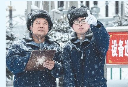
供电公司工作人员巡检变电站设备。

现电力故障,供电公司将会第一时间派人进行巡视抢修,欢迎大家及时、准确地反映故障地点。降雪期间天气寒冷,一些电褥子、电暖气、电暖风等采暖设施也随之大量投入使用,请广大市民合理使用大功率取暖设备,安全用电。