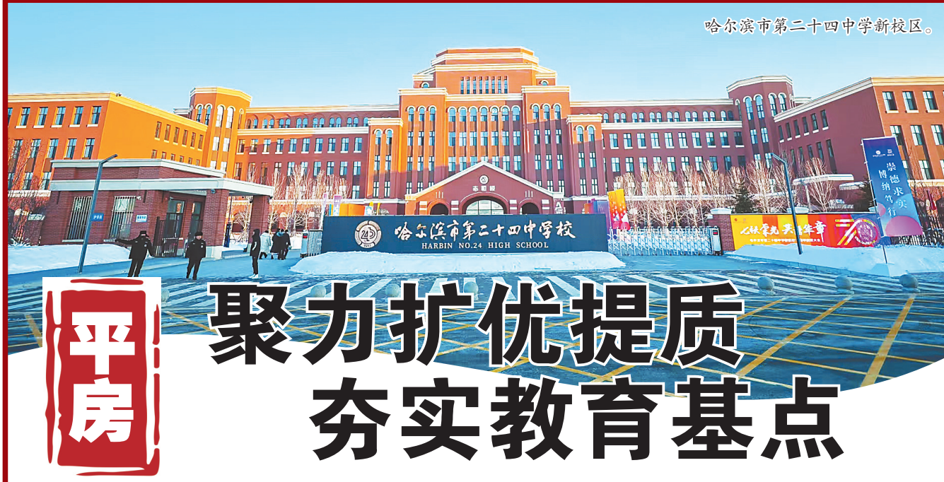
哈尔滨市第二十四中学校。

据统计,双城区检察院围绕农民工权益保障、就业保障、妇女权益保障等民生热点及相关重点人群,共开展“典”亮春耕、“典”亮童心、“典”亮夕阳等定向普法宣传活动10余次,受众人数千余人次。下一步,双城区检察院将继续对标群众法治需求,高质效办好每一起民生“小案”,让群众感受到公平正义。