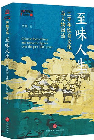
《至味人生：三千年饮食文化与人物风流》/李凯/天地出版社/2024年3月

饮食是生存的第一要素,是人类日常生活的重要环节。古往今来,谈饮食的书不少,大多是讲烹饪方法的,可以照着做。比如苏轼在惠州烤羊蝎子,要“渍酒中,点薄盐炙微焦食之”。或者如袁枚,在吃了什么好菜后,都要留心其做法,记在《随园食单》里,而且还能总结,概括一番道理来——不仅有吃的艺术,还有吃的哲理。近年来,随着“舌尖上的中国”火遍大江南北,关于食材、厨艺和人们心得的著作陡然增多。 但这本由历史学家李凯撰写的《至味人生：三千年饮食文化与人物风流》,和一般食单、食谱不同,作者以“食”之名,由食讲人,讲史,其所感触,较之油盐酱醋、鸡鸭鱼肉更有魅力,更能教化人心。“一切历史都是思想史”,作者以一个历史工作者的视角,打破就事论事的窠臼,在基于审美、伦理、文化价值等方面进行遴选。此书既没有局限于宏伟叙事的大理论,也没有纠结于抽象的历史符号与条条框框,而是用一些生动具体的过程情节来论述三千年饮食文化与人物风流,在历史叙述中突出人,突出人物在特定历史环境下的思考。如作者所言,古人也是人,和现代人活在同一片天空下,总有共同的话题。 本书脱胎于央视百家讲坛“舌尖上的历史”第二部讲稿,经过整理润色,以年代为序,用14个章节,选取了伊尹、孔子、屈原、刘安、杜甫、苏轼等广为人知的历史名人,糅合他们与寻常饮食的深厚渊源与人文典故,带领我们在饮食与名士的相互关联中,深入体味中华文化的精神基因。 在每一章的开头,作者都以一种食物为引,描写历史长河中与之有关的只鳞片羽,继而由“食”及“人”,再延伸到“史”。如开篇讲述厨师鼻祖伊尹,善于调和五味,借烹饪之技向商汤阐述治国之道,作者追溯起源,以“治大国,若烹小鲜”的思路来诠释;孔子“疏食饮水”,倡导“君子食无求饱,居无求安”,主张儒者要提升精神境界和执政水准;作者结合《楚辞》等文献,向我们生动呈现了爱国诗人屈原的另一面,“朝饮木兰之坠露兮,夕餐秋菊之落英”的同时,也同样爱肉,楚国贵族的身份与他追求高洁精神的形象并不矛盾。同样还有大文豪苏轼,作者从《苏轼帖》的字里行间追寻苏轼在海内“食无肉、病无药、居无室、出无友、冬无炭、夏无寒泉”的生活经历和苦中作乐的精神面貌。他视人生如逆旅,天地一瞬和我我无穷,不过是人的一念之间。 作者引用了大量文集、笔记等史料,把饮食和叙事、历史和自然融合地交错在一起,一个个大人物的人生纷纷跃然于纸上。比如人们把第一个吃螃蟹的人附会成汉武帝刘彻,他威加四海,营建了恢宏的汉家气象;曹操是一代枭雄,煮酒论英雄,体现了政治家的雄心;唐玄宗对胡食者不拒,期望万邦咸宁,哪想到渔阳鼙鼓,尘器直上;宋徽宗的盛宴,玩出了品位,像郑板桥那样当个艺术家多好,青菜萝卜糙米饭,心怀坦荡,返璞归真。此外,书中还介绍了“茶淫橘虐”的纨绔子弟张岱,精通饮食的休闲文化代表李渔,以及能对厨师“执弟子之礼”的文学家袁枚…… 书中涉及的14种食物,从口腹之欲到精神需求,与其说这是一部美食起源史,不如说是一部由人物贯穿而起、内涵深厚的文化史和精神史。书中列举的每位人物都有不同的人生境遇和处世哲学,作者把他们的精神气质与饮食追求融入食材、厨艺、风味之中,发微生理趣,将中国饮食文化描绘为一幅契合时代精神与民族命运的历史画卷。历史的教育价值在于明理,在饮食中发见人,在共情中理解人,更能体味历史的永恒魅力。