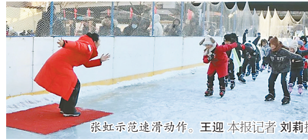
张虹示范速滑动作。

本报讯(吴昌林 王迎 记者刘莉)为营造冰雪活动的氛围,丰富学生冰雪活动内容,增进学生身心健康,日前,以“香坊真香迎亚冬 冰雪同梦向未来”为主题的香坊区“百万青少年上冰雪”活动启动仪式在哈尔滨市公滨小学校举行。国际奥委会委员、哈工大奥林匹克研究中心主任、虹基金理事长、冬奥会冠军张虹参加了此次活动。 在铿锵的旋律下,张虹与充满朝气的学生们开启了一场别开生面的互动,瞬间点燃了学生们的热情。冰场上,张虹示范速滑动作技巧,学生们围聚在冠军身旁,眼睛紧紧盯着每一个动作细节,有模有样地学起来。 据悉,香坊区教育局将借助各级冰雪特色学校拓展“冰雪冠军项目”,挖掘冰雪名师力量,雕琢冰雪体育课程,为青少年开辟冰雪运动成长天地。继续以冰雪为载体,全力营造冰雪氛围,挖掘和储备人才,致力打造香坊特色冰雪体育品牌,助力教育强国建设,为亚冬会献上青春贺礼。