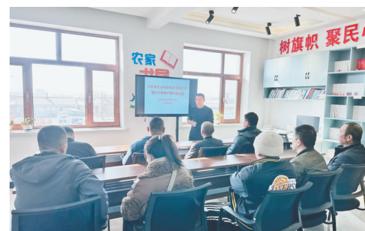
在农家书屋开展科技下乡科普活动。