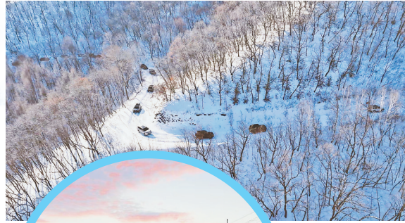
↑车队穿越林海雪原。