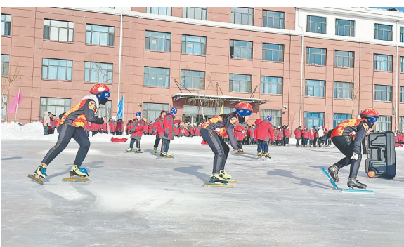
汤原县第一小学开展冰上运动。

以文塑旅、以旅彰文,汤原县冰雪新天地深度融合中华优秀传统文化内涵,发展新一代冰雪产业综合体,助推冰雪文旅产业发展的新潮流。