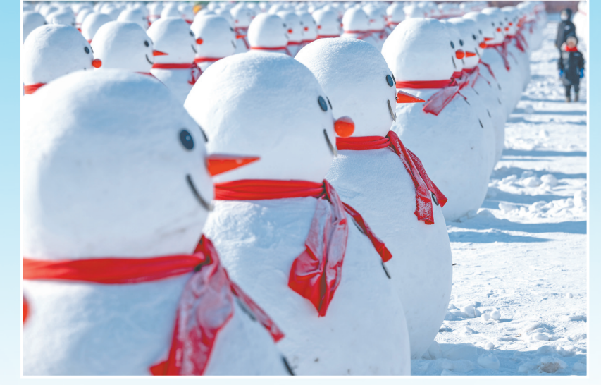
在北大荒集团国家岗农场,游客在雪人群中游览。