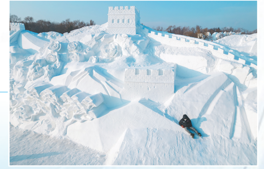
游客在哈尔滨太阳岛雪博会园区内游玩(无人机照片)。