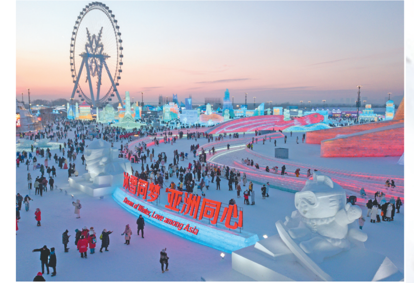
游客在哈尔滨冰雪大世界园区内游玩(无人机照片)。