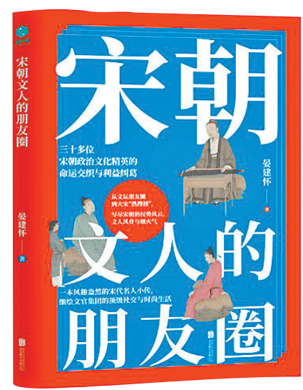
《宋朝文人的朋友圈》/晏怀钧/北京联合出版有限公司/2024年11月

《宋朝文人的朋友圈》不仅是一本关于宋朝文人的历史读物，更是一本充满智慧与启迪的人生哲学书籍。读完这本书，给人一种穿越千年的奇妙感。仿佛看到宋朝的文人们在朋友