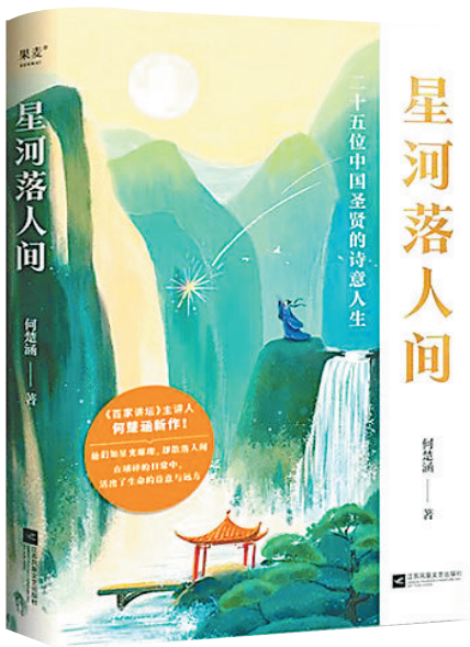
《星河落人间》/何楚涵/江苏凤凰文艺出版社/2024年6月

《星河落人间》将文化圣贤的人生故事汇聚在一起，让我们在阅读中感受到了中华文化的无限魅力。我们阅读圣贤、走近古人，去感受那种坚韧与豁达，把生活的风霜化作诗意的雨露。愿我们通过这些圣贤的故事，汲取智慧与力量，活出自由和洒脱的人生。