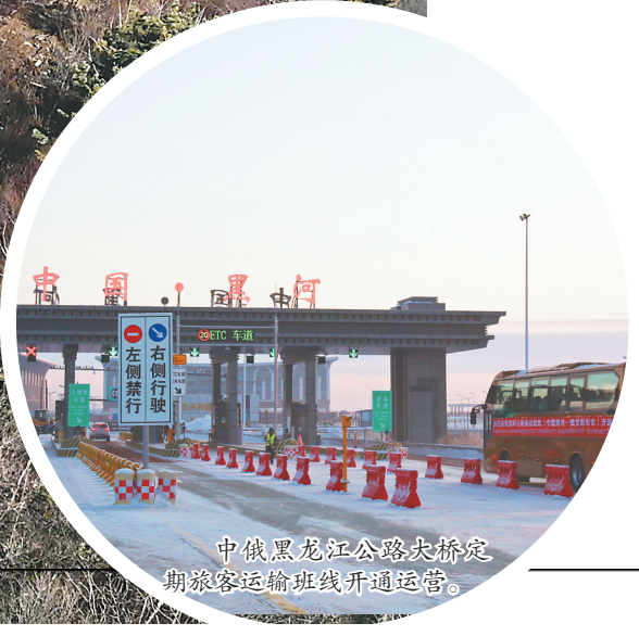
中俄黑龙江公路大桥定期旅客运输航线开通运营。