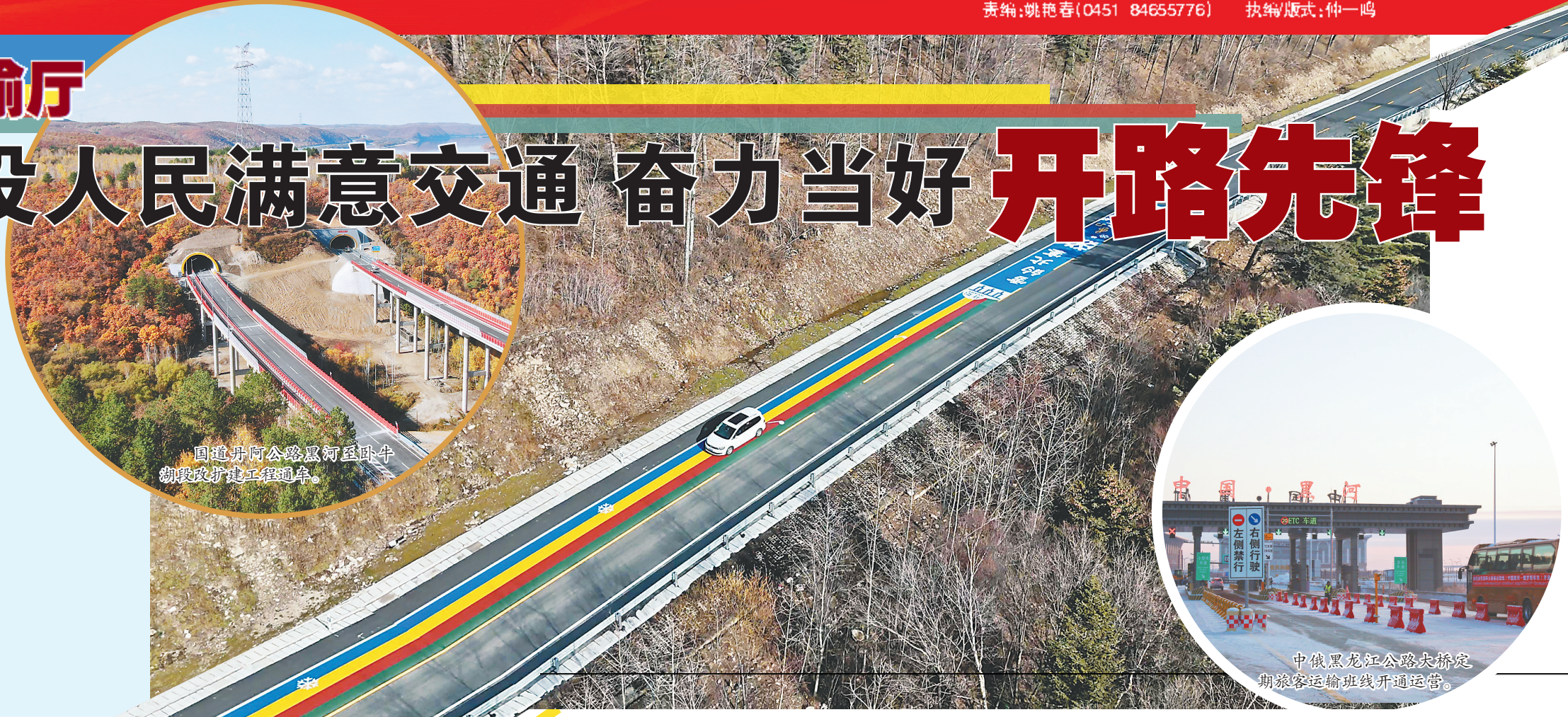
国道丹阿公路双河至卧牛湖段改扩建工程通车。

交通是中国现代化的开路先锋。省交通运输厅深入贯彻习近平总书记关于交通运输重要讲话重要指示,落实省委省政府决策部署,解放思想,激发动能,加快交通强国建设步伐,努力建好人民满意交通,全面推进交通运输高质量发展,为中国式现代化龙江实践提供支撑服务保障。