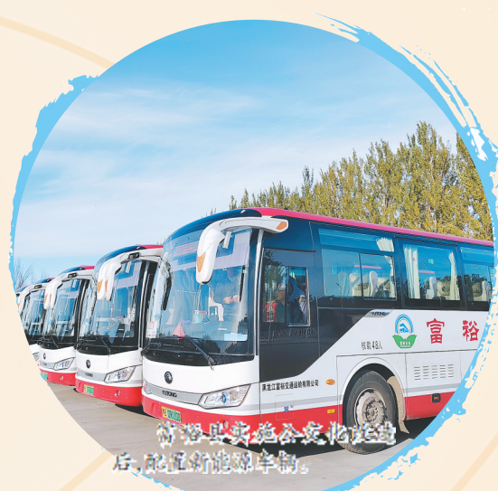
后,推广应用新能源车。

下一步,省交通运输厅将深入贯彻党的二十大精神,按照省委省政府部署要求,全面深化综合交通运输体系改革,围绕服务建好建强“三基地、一屏障、一高地”,加快构建安全、便捷、高效、绿色、经济、包容、韧性的可持续交通体系,服务保障建设“六个龙江”、推进“八个振兴”,奋力当好中国式现代化龙江实践的开路先锋。