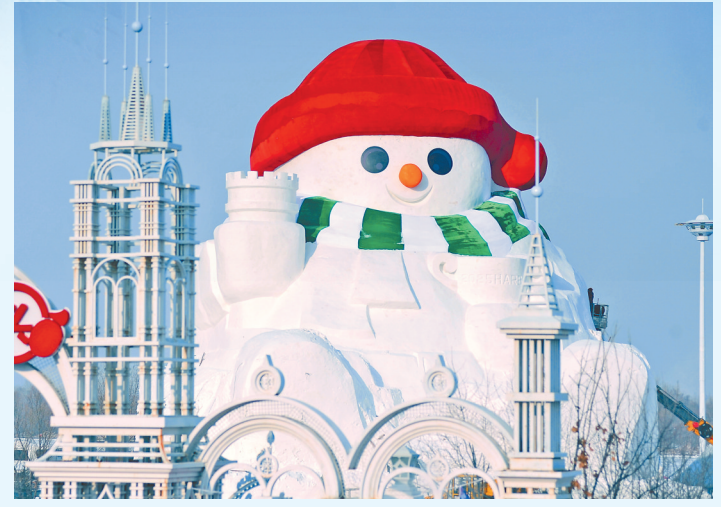
哈尔滨市群力江畔雪人码头的大雪人。