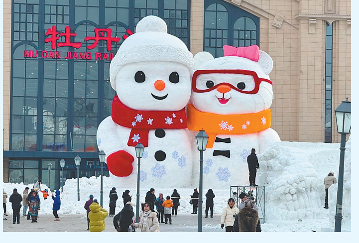
牡丹江火车站北广场上的“拥抱亚冬”主题大雪人。

大雪人的问候 在这个冬天,总会有什么能够暖到你。那是一道光,从高处或者远处,从大雪人的眸间,到达回头一望的你。 大雪人的问候,比微风更轻柔,比阳光更炽热,比满目无垠的雪野更纯白,从任意角度看过去,它都在与你对视,像极经历三世追寻的有缘人,彼此心动的感觉。 大雪人的问候,来自龙江冰雪季,来自不是幻觉的幻觉,来自一丛熊熊燃烧且永不熄灭的篝火,在你刚刚感到冷的时候,它就会抱你入怀,给你讲“尔滨”的童话故事。 大雪人的问候,把浪漫放大了何止一倍,诗和远方同时出现在眺望深处,如果此际,好听的音符随着好看的雪花从天而降,你是否会觉得幸福来的正是时候。 作为龙江冬天的主角,大雪人从来都没有缺席过,它以不同的样态对你微笑,你会恍以为自己与它,曾在某一场梦里见过,你可以大声对他说,“‘缘’来你在这里。” 好听的故事总要有个开头,龙江之冬的童话就从大雪人讲起。