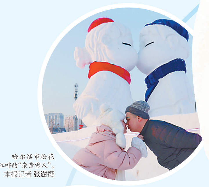
哈尔滨市松花江畔的“亲亲雪人”。