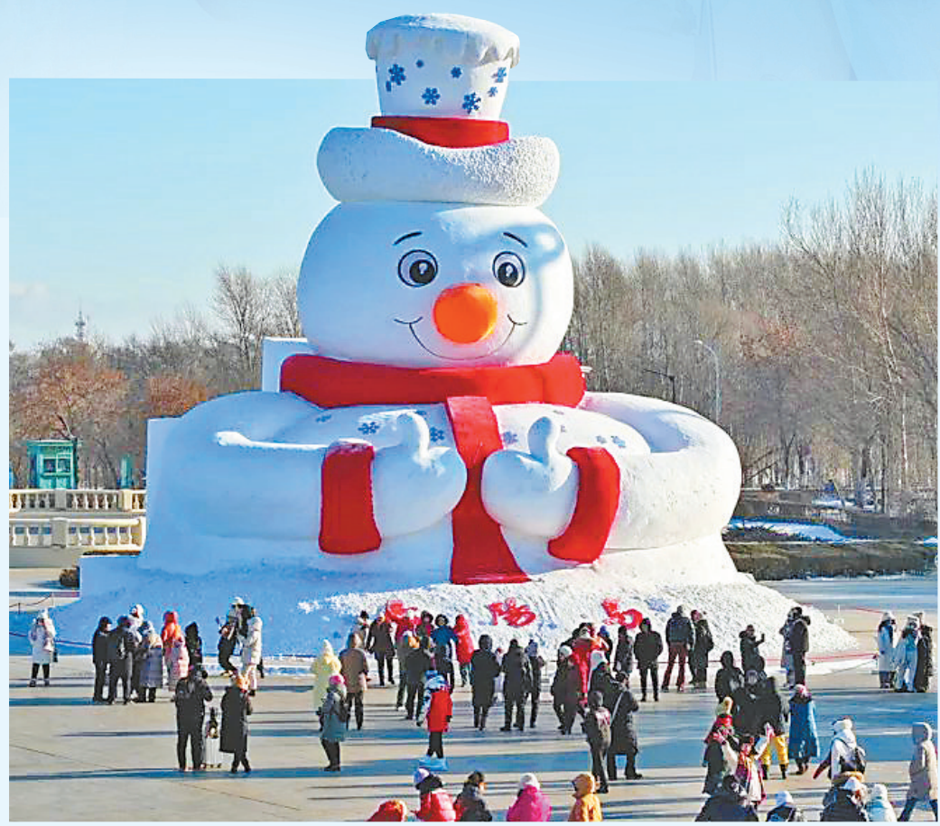
太阳岛雪博会的“雪人先生”。

大雪人的问候 在这个冬天,总会有什么能够暖到你。那是一道光,从高处或者远处,从大雪人的眸间,到达回头一望的你。 大雪人的问候,比微风更轻柔,比阳光更炽热,比满目无垠的雪野更纯白,从任意角度看过去,它都在与你对视,像极经历三世追寻的有缘人,彼此心动的感觉。 大雪人的问候,来自龙江冰雪季,来自不是幻觉的幻觉,来自一丛熊熊燃烧且永不熄灭的篝火,在你刚刚感到冷的时候,它就会抱你入怀,给你讲“尔滨”的童话故事。 大雪人的问候,把浪漫放大了何止一倍,诗和远方同时出现在眺望深处,如果此际,好听的音符随着好看的雪花从天而降,你是否会觉得幸福来的正是时候。 作为龙江冬天的主角,大雪人从来都没有缺席过,它以不同的样态对你微笑,你会恍以为自己与它,曾在某一场梦里见过,你可以大声对他说,“‘缘’来你在这里。” 好听的故事总要有个开头,龙江之冬的童话就从大雪人讲起。