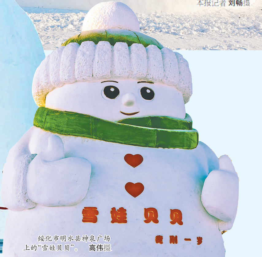
绥化市明水县神泉广场上的“雪娃贝贝”。