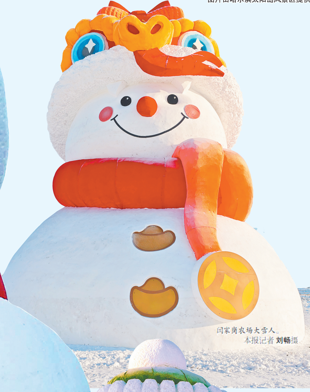
闫家岗农场大雪人。