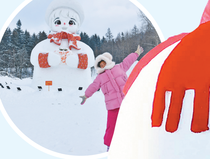
雪乡16米高大雪人。