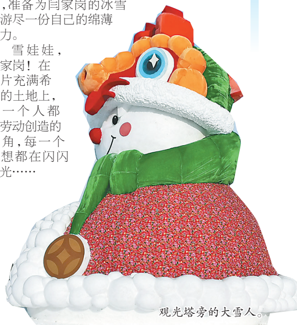
观光塔旁的大雪人。