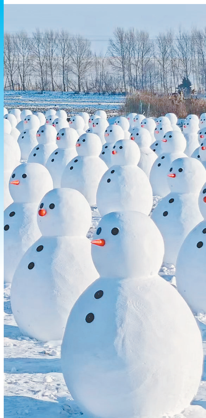
面带微笑的“雪人军团”。