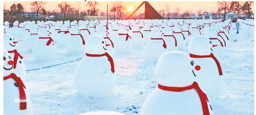
由八百个微型雪人组成的“雪人军团”。

家了,咱得给客人让路,人家这可是为咱黑龙江经济建设做贡献呢,旅游经济拉动餐饮、住宿一条龙,连咱家的农特产品都跟着借光儿,卖得可好了!”