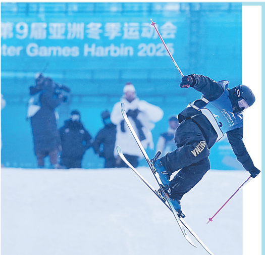
第九届亚冬会比赛现场。

本版主编:李 飞(0451-84612318) 本版责编:刘 莉(0451-84655327) 执行编辑:刘 艳(0451-84612162) 美 编:倪海连(0451-84655238)