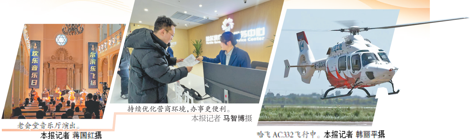
老会堂音乐厅演出。

推动文旅内涵式高质量发展。扩大夏季避暑、冬季冰雪高质量特色产品供给,厚植历史文化内涵和生态、科技优势,进一步提升国际冰雪节、哈夏音乐会、国际啤酒节规模和影响力,发展避暑、康养、演艺、研学等“旅游+”业态,构筑全域全季旅游新格局。