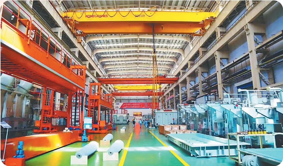
工业企业生产现场。

发挥国土空间总体规划统筹引领作用,推进城中村、城市更新等控制性详细规划编制、专项规划修编。强化违法建设防控和查处长效机制。工业、服务业项目实行“先定项目后供土地”。合理调控房地产用地供给,建设满足群众需求的好房子。