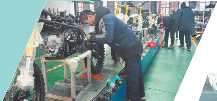
生产加工雪地摩托。