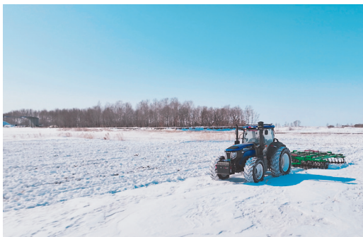
耙雪化冻散墒作业。