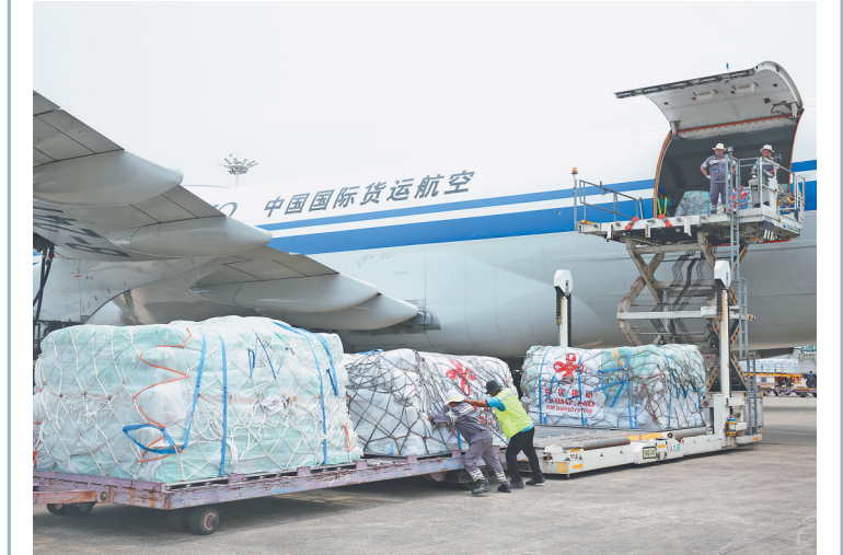
4月9日，中国政府向缅甸提供的第五批紧急人道主义地震救援援助物资抵达缅甸仰光国际机场。

出包括1名孕妇在内的9名幸存者，搜寻到59具遇难者遗体，搜索排查28.7万平方米的房屋建筑和重要基础设施，开展受灾群众义诊2000余人次。