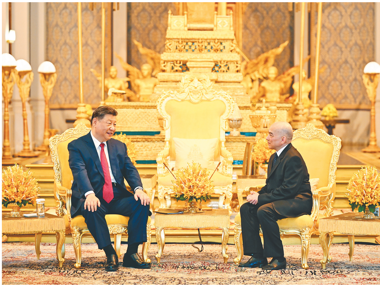
四月十七日下午，柬埔寨国王西哈莫尼同中国国家主席习近平在金边王宫举行会见。

新华社金边4月17日电(记者倪四义 李凯 吴长伟)4月17日下午，柬埔寨国王西哈莫尼同中国国家主席习近平在金边王宫举行会见。