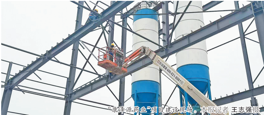
“康泽源药业”项目建设现场。

与此同时,珠海澳湾运营管理有限公司健康产业游学生产基地项目的规划设计已完成,正在进行设备选型订购,配建的标准