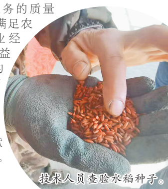
技术人员查验水稻种子。

继续加大对规模种植户、传统农户春耕生产和农业农村领域的支持力度,不断创新金融产品和服务方式,提高金融服务的质量和水平,满足农户和农业经营主体日益多样化的金融需求,继续为农业农村事业发展贡献力量。