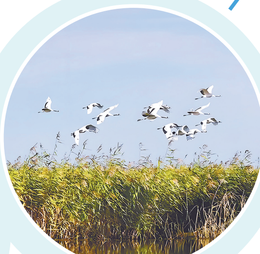
龙腾湿地公园景观。

富裕县龙安桥龙腾湿地公园在我的老家小河东村东南侧,离家乡不到两公里,是国家AAAA级旅游景区。春天来临,天空渐渐变得明亮起来,云朵也变得愈加轻盈和洁白,大地上的积雪已融化。这个季节正是龙腾湿地万物复苏草长莺飞的时候。