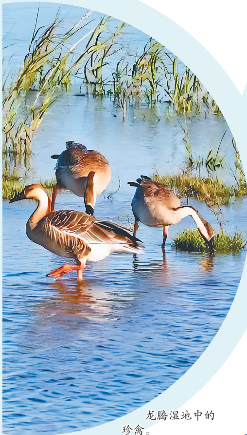
龙腾湿地中的珍禽。