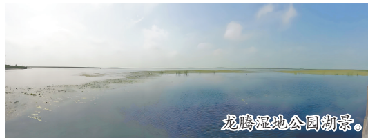
龙腾湿地公园湖景。

2014年,在大碱泡子附近打出了温泉,温泉水源自地下1651米深处的岩层,水温达到53摄氏度,含有多钟对人体有益的微量元素。去年,经中国环境科学研究院对龙腾湿地泉水进行了全面评估,得出的结论是湿地泉水水质硬度适中、天然呈弱碱性、富有30多种对人体有益的矿物质和微量元素。长期饮用对人体具有良好的保健作用,完全符合饮用矿泉水标准。为了开发利用好温泉资源,开发商又投入资金,购买了全自动矿泉水生产设备,打造出“龙湿地”矿泉水品牌,成功地将生态优势转化为经济效益,带动了旅游业的发展。