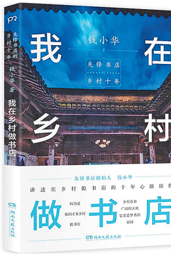
《我在乡村做书店》/钱小华/湖南文艺出版社/2025年1月

的责任有了更明确的担当。它激励着我不断探索中国文化的奥秘，将这份宝贵的文化遗产传承下去，为中国文化的发展贡献自己的一份力量。