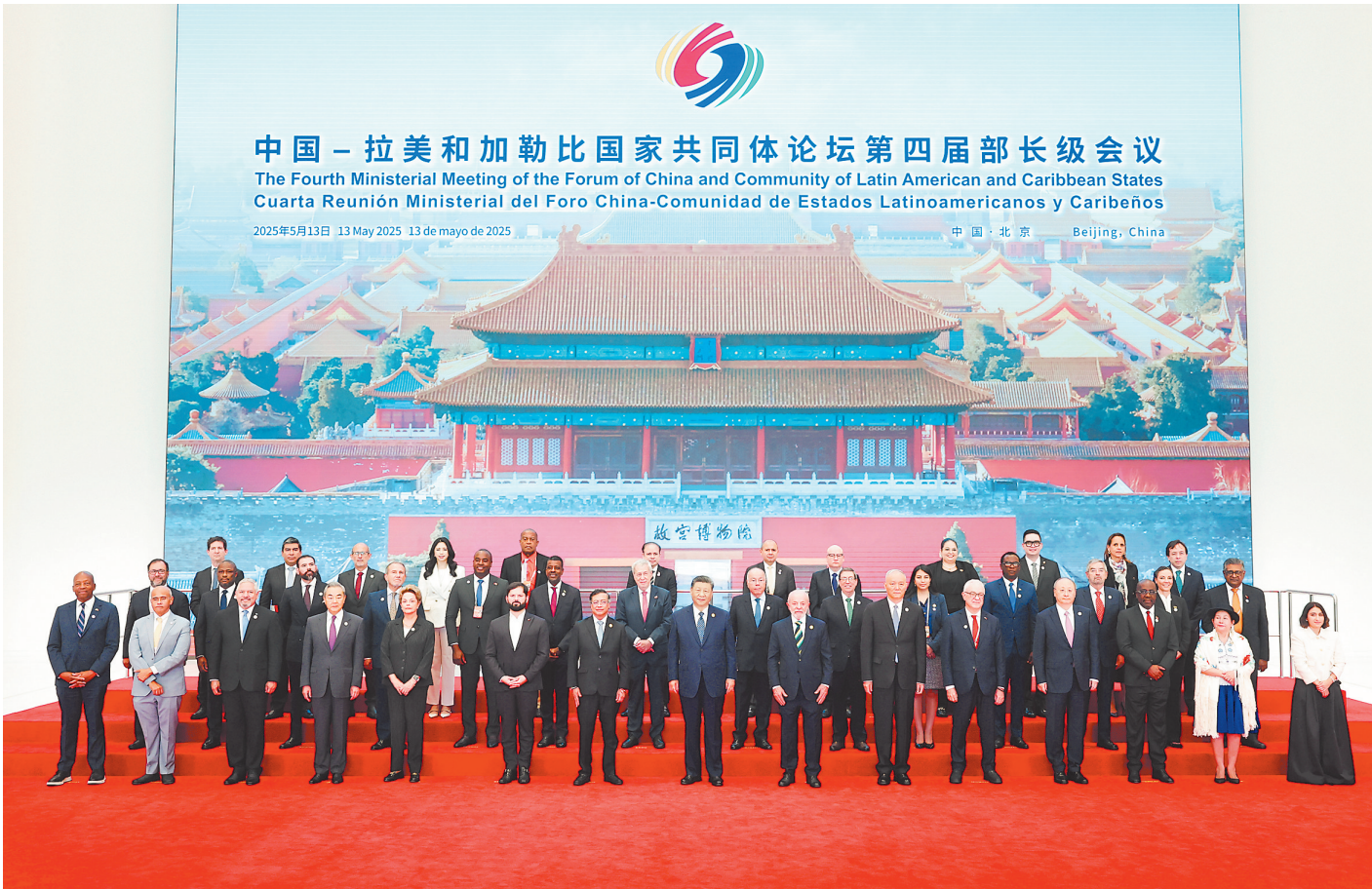
5月13日上午,国家主席习近平在北京国家会议中心出席中国-拉美和加勒比国家共同体论坛第四届部长级会议开幕式并发表主旨讲话。这是习近平同与会嘉宾集体合影。

新华社北京5月13日电(记者马卓言冯歆然)5月13日上午,国家主席习近平在国家会议中心出席中国-拉美和加勒比国家共同体论坛第四届部长级会议开幕式并发表主旨讲话。习近平宣布,中方同拉方携手启动五大工程,共谋发展振兴,共建中拉命运共同体。