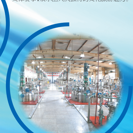
大庆华理生物生产车间。