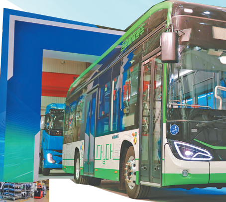
东北地区首批醇氢新能源专用车在大庆下线。