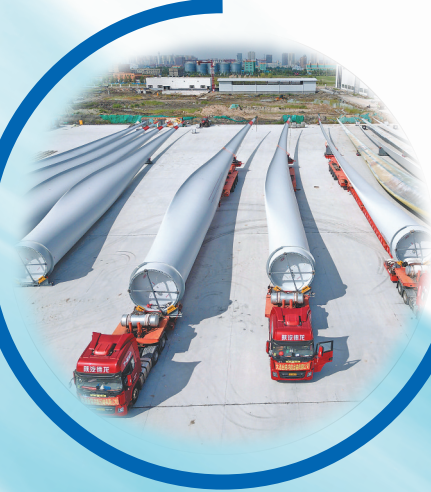
明阳风电生产的风机叶片。