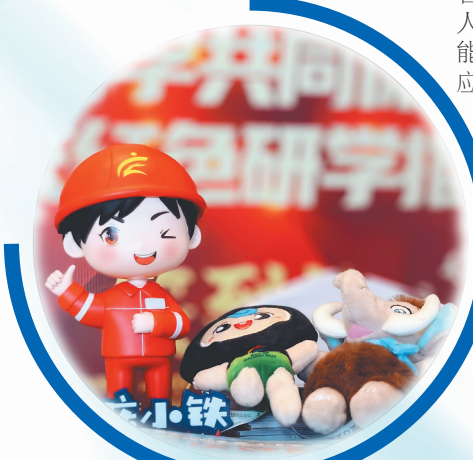
大庆小铁、油油、萌萌玩偶。

恒驰电气作为国内油田零碳微网解决方案的首家企业,带来了一系列具有自主知识产权的智能产品。智能机器人手臂具有高精度、高精度优势,可适用于各种工业生产人力替代解决方案;绿电智能抽油机控制系统(微电网)沙盘,以光能、风能、储能三种能源组成电力来源,实现绿电独立供给、能源统一调配等功能,推动传统数据中心走向智慧数据中心;激光巡检机器人可用于自主定航巡检,AI智能识别、激光气体检测,广泛应用于军工、石油石化等行业。