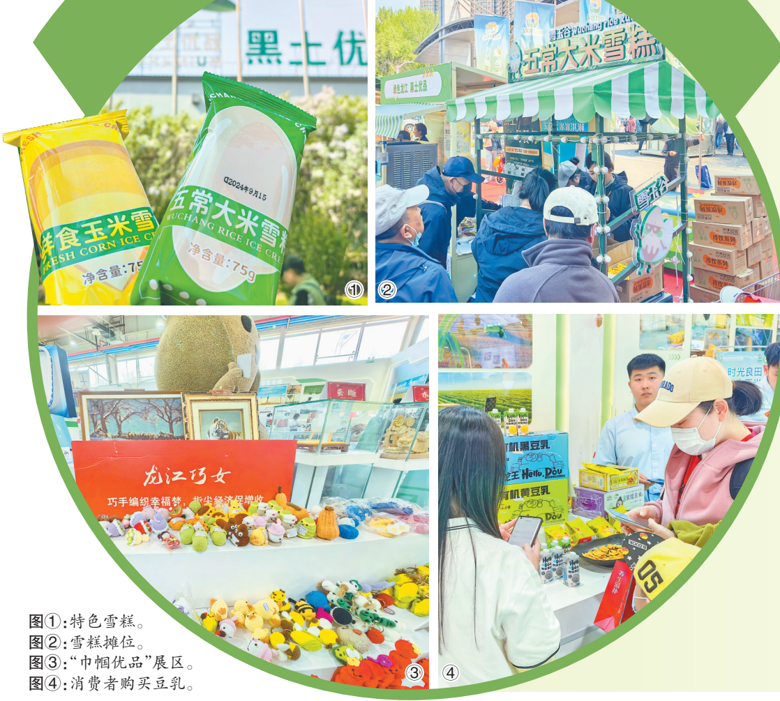
图①：特色雪糕。 图②：雪糕摊位。 图③：“巾帼优品”展区。 图④：消费者购买豆乳。