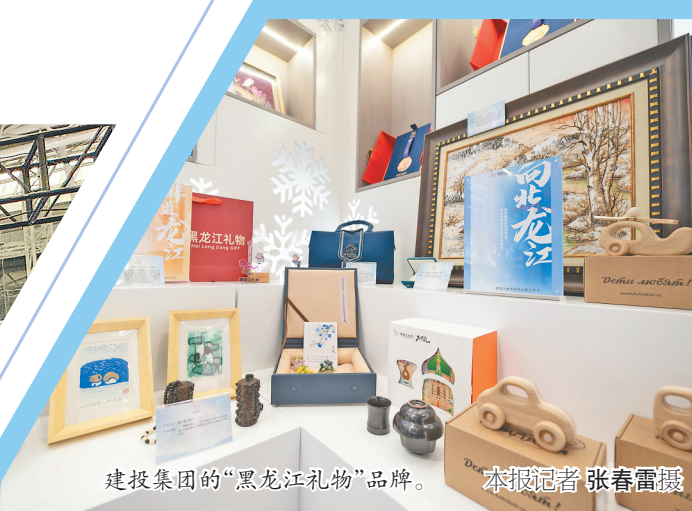
建投集团的“黑龙江礼物”品牌。

行走在数字经济、生物经济、冰雪经济、创意设计四大展区,能清晰地感知到龙江发展的蓬勃动力。哈洽会的帷幕终将落下,但龙江大地上的变革仍在继续。四大经济板块勾勒出的,不仅是当下的产业图景,更是一条充满希望的向新之路。