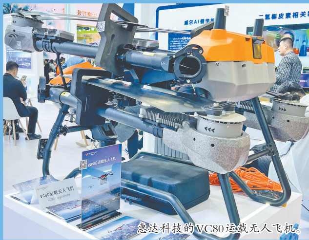
意达科技的VC80运载无人机。

在哈洽会的舞台上,黑龙江国有企业的组团亮相,既是对过往发展成果的集中展示,更是对未来发展的庄严承诺。他们以战略布局彰显担当,以创新驱动引领变革,以业态融合拓展空间,以改革赋能激发活力,在龙江振兴的征程中留下了浓墨重彩的一笔。