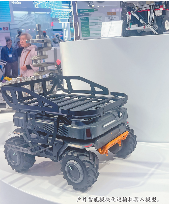
户外智能模块化运输机器人模型。

哈洽会上,哈尔滨灵思吾耀创意设计有限公司参展的“龙江美景”“冰城十景”等系列叶雕工艺品,也受到了广泛关注与好评。哈尔滨极地公园与中朗创意设计联合打造的全国首个AI文旅互动玩偶“AI淘淘”,带来了AI科技与童趣萌宠的完美融合。法国设计奖金奖、伦敦设计奖金奖、美国好设计奖铂金奖、纽约产品设计奖银奖……展厅内,哈尔滨新区创意设计产业园企业系列荣誉展台,向世界展示着哈尔滨新区创意设计的实力与收获。