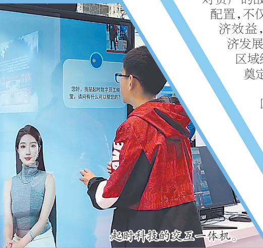
起时科技的交互一体机。