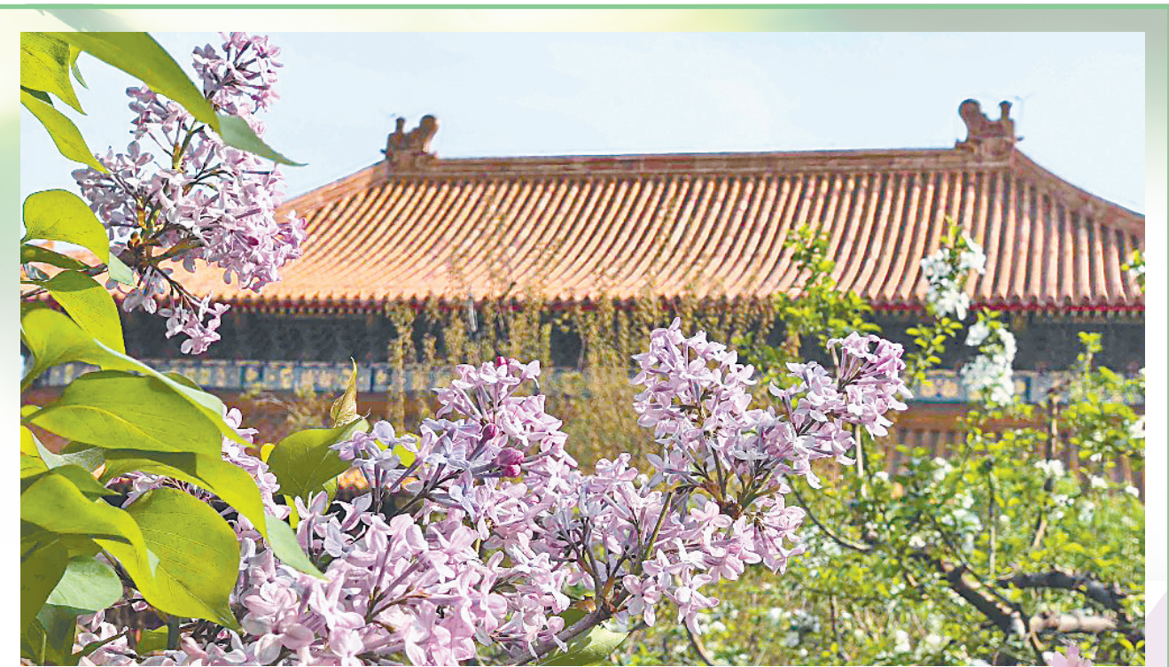
左图:花香四溢。右图:丁香古韵。