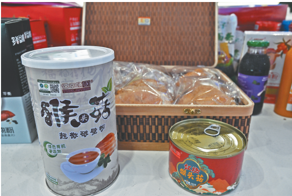
老谢合作社的产品。