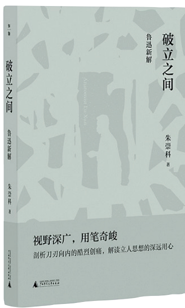
《破立之间：鲁迅新解》/朱崇科 广西师范大学出版社 2024年12月

转化为知识分子在启蒙困境中的存在隐喻。这种对文本褶皱的深度挖掘，既跳出传统“自我解剖说”的阐释窠臼，又借助时空诗学理论，将“以黑暗沉没换取光明新生”的牺牲精神锚定在具体叙事策略中。值得注意的是，此种方法论创新贯穿全书。当论及“立人”思想时，朱崇科将孔子“立人”说、孟子民本思想与尼采个体本位主义并置考察，在跨文化谱系中还原鲁迅“尊个性而张精神”命题的历史纵深感，既呈现其对封建伦理的激烈反叛，又凸显其对士人精神的创造性转化。