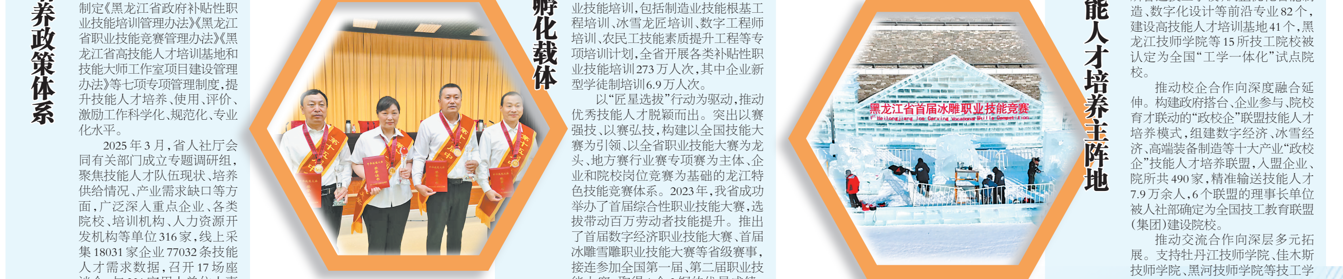
中华技能大奖获得者、全国劳模模范刘伯鸣。 黑龙江省中华技能大奖获得者。 黑龙江省首届冰雕职业技能竞赛。

C 做强技工教育 夯实技能人才培养主阵地 技能人才培养,离不开技工教育。黑龙江省是技能人才大省,也是全国技工教育发展较早的省份,1948年成立了第一所技工院校,“一五”时期,国家布局的156个重点工业项目中,有22个扎根于此。从新中国成立初期的“工业摇篮”到当前打造“全国重型装备制造生产基地”,技工教育始终是技能人才培养的主阵地。 推动技工院校向强基培优升级。全省技工院校坚持服务就业的办学准则、能力为本的办学思路、校企合作的办学特色、工学一体的办学模式,紧跟产业发展、紧盯企业需求布局院校、设置专业、优化师资、建设平台,有效发挥技工院校技能人才培养主阵地作用。省内14所技师学院、11所高级技工学校、79所普通技工学校,调整优化智能制造、数字化设计等前沿专业82个,建设高技能人才培训基地41个,黑龙江技师学院等15所技工院校被认定为全国“工学一体化”试点院校。 推动校企合作向深度融合延伸。构建政府搭台、企业参与、院校育才联动的“政校企”联盟技能人才培养模式,组建数字经济、冰雪经济、高端装备制造等十大产业“政校企”技能人才培养联盟,入盟企业、院所共490家,精准输送技能人才7.9万余人,6个联盟的理事长单位被人社部确定为全国技工教育联盟(集团)建设院校。 推动交流合作向深层多元拓展。支持牡丹江技师学院、佳木斯技师学院、黑河技师学院等技工院校依托地缘优势与俄罗斯远东地区职业院校在学历提升、技能竞赛、职业技能培训等方面开展校校合作,在俄方建立培训基地培养境外就业的技能人才,牡丹江技师学院、佳木斯技师学院被人社部评为“一带一路”技能筑梦培训基地。支持哈尔滨新区开展中外合作职业技能培训项目,开展AHK、IHK(主要对应国内铣工、电工、钳工等)职业技能培训发证活动。 匠心筑梦龙江,技能照亮前程。未来,我省将进一步完善政府推动、企业主体、院校基础、产业导向的技能人才培养体系,大力实施“技能龙江 照亮前程”技能人才培养专项行动,加大战略性新兴产业和未来产业技能人才有效供给,加强急需紧缺技能人才职业技能培训,为加快发展新质生产力和构建“4567”现代化产业体系提供有力技能支撑,推动技能“软实力”成为龙江振兴发展的“强动力”。