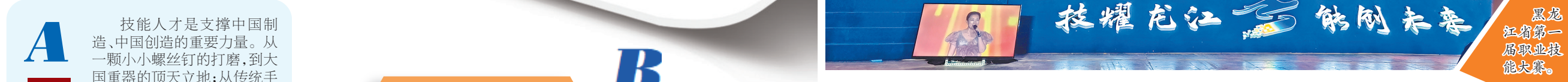
黑龙江省第一届职业技能大赛暨第二届全国技能大赛黑龙江选拔赛 黑龙江省第一届职业技能大赛。

□本报记者 李播 他们的手是精准的标尺,在精密制造的世界里,每一次转动,每一次校准,都是对极致的追求;他们的手是炽热的画笔,在钢铁的世界里,用高温与专注描绘出坚固与美丽;他们的手是魔法的权杖,在平淡的日子里,在面粉与糖相遇后,在每一次搅拌中,渲染出甜蜜与幸福…… 一刀一刻,皆是匠心;方寸乾坤,链接万象。在黑龙江这片充满希望的黑土地上,有这样一群人,他们用双手书写传奇,用匠心铸就辉煌—— 截至2024年底,我省技能人才总量266.9万人,其中高技能人才83.8万人。省内共有特级技师456人、首席技师202人,189人荣获“全国技术能手”,15人荣获“中华技能大奖”。共有技工院校104所,在校生5.5万人,当年招生2.02万人,毕业生2.68万人,就业率98.35%。当年组织开展补贴性职业技能培训24.4万人次,完成目标任务的116.2%,其中农民工11.3万人次。共建设99个高技能人才培训基地和225个技能大师工作室。当年新增取得高级工以上职业资格证书或职业技能等级证书2万人次,其中技师及以上4977人次。建有省级职业技能竞赛集训基地6个。 数字记录着变化,数字见证着发展。近年来,全省技能人才队伍建设工作持续提档升级,技能人才在龙江大地不断书写着精彩华章。