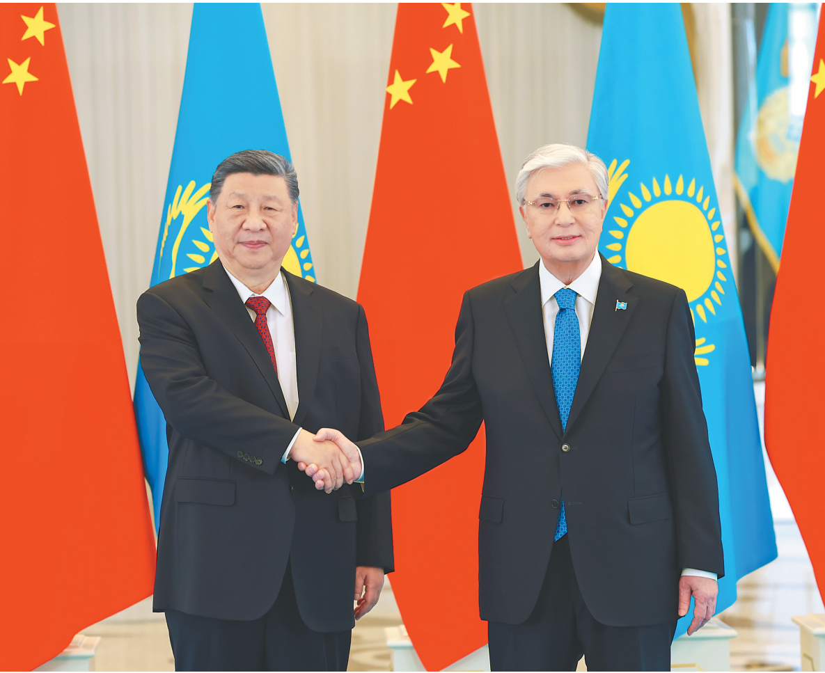
当地时间六月十六日下午，哈萨克斯坦总统托卡耶夫同中国国家主席习近平在阿斯塔纳总统府举行会谈。

新华社阿斯塔纳6月16日电(记者倪四义 胡晓光)当地时间6月16日下午，哈萨克斯坦总统托卡耶夫同中国国家主席习近平在阿斯塔纳总统府举行会谈。