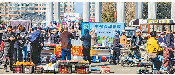
社区“幸福集市”居民义卖活动现场。