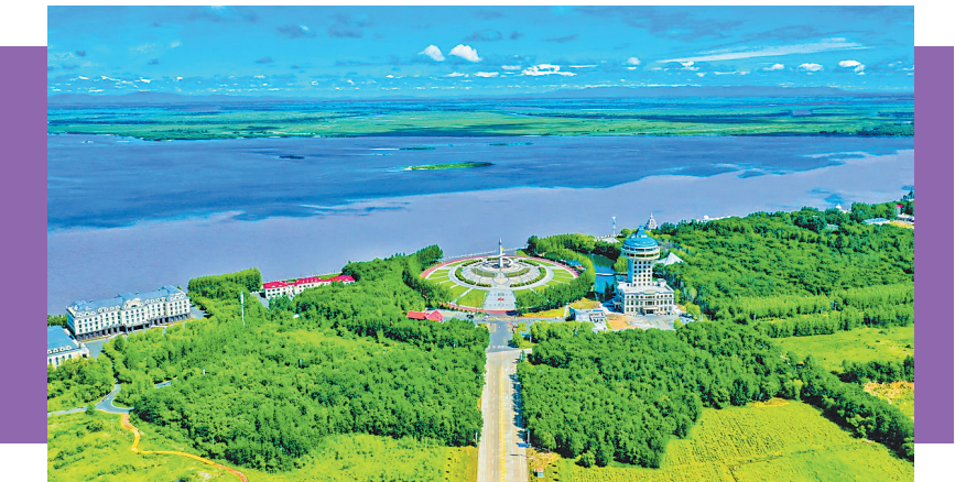
同江市三江口生态景区。

强化稳边基础。以建设“同心向党”党建品牌为引领,实施基层党建全域提升行动,搭建党建引领口岸发展融合载体,建立轮值主席、督导问效等工作机制,明确商务口岸、边检、海关等部门职责,让党的组织触角延伸到各领域最前沿。充分发挥党委统揽全局作用,实施党政军警民“五位一体”联合管边控边机制,深入开展“军警地”共建,切实带动党