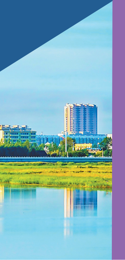
从湿地公园看城市美景。