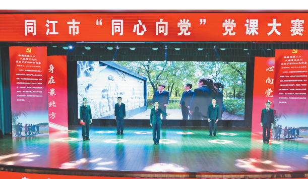
“同心向党”党课大赛现场。