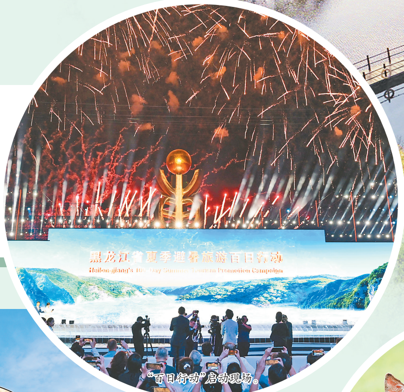
黑龙江夏季避暑旅游“百日行动” Heilongjiang's 100-day Summer避暑旅游百日行动

如火如荼,当乌苏里江畔的清风吹散盛夏的燥热,兴安岭的林海翻涌无限绿浪,一场为期百日的“清凉盛宴”点燃了黑龙江夏季旅游的“黄金引擎”。7月2日20时,在佳木斯市抚远市举行的“东极之光”2025黑龙江省特色文化旅游推介会上,2025年黑龙江省夏季避暑旅游“百日行动”正式启动,升级推出的各项活动和措施,为龙江夏季旅游注入了强劲动力。 自2022年创新推出以来,黑龙江连续四年实施夏季避暑旅游“百日行动”,整合资源、打造品牌、提升服务,成效斐然。去年夏季,全省接待游客数量与旅游收入再攀新高,多地市成为蜚声全国的热门避暑旅游目的地。 今年,黑龙江省夏季避暑旅游“百日行动”的活动周期为7月1日至10月8日。在承袭往年成功经验的基础上,全新升级“避暑胜地·清凉龙江”夏季旅游品牌,秉持市场化运营、标准化建设、规范化管理、智慧化赋能原则,围绕“食住行游购娱学”全要素供给,实施十大专项行动,进一步丰富“十”大主题线路、“百”场美食盛宴、“千”台文旅盛事和“万”种龙江好物,努力打造全国夏季避暑旅游引领区。