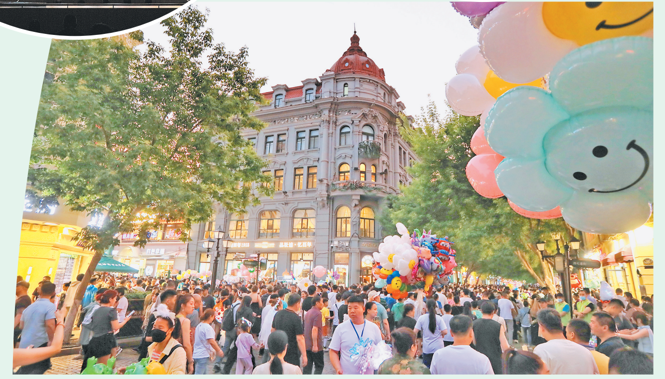
中央大街游人如织。

今夏,黑龙江各地的文旅融合演艺活动精彩纷呈:第7届哈尔滨国际手风琴艺术周、第20届萨克斯管大会、鹤城仲夏话剧演出季、欢腾牡丹江文旅消费季、大庆缤纷夏日演出季、鸡西兴凯湖音乐节、伊春森林电音狂欢季、七台河万宝音乐节、黑河“龙江夜宴”界江之旅演艺、“声动绥化”消夏K歌赛、漠河“寻梦兴安”驻场演出……从剧场驻演到街头快闪,从实景沉浸到音乐狂欢,形式多样,精彩不断。 为了让游客获得更具性价比的文旅服务,黑龙江各地将切实实施“百城百区”“百城千站”文旅消费行动计划,发放文旅消费券、推出消费优惠措施,并联合旅游线上平台、金融机构推出景区门票、酒店住宿、文化娱乐、交通出行等消费惠民补贴,让清凉之旅更超值。 号角已响,再启新航!2025黑龙江夏季避暑旅游“百日行动”正通过完善设施、提升服务、强化监管、提振消费等组合拳,构建“全域联动、全季贯通”的避暑旅游新格局。不仅将“天然空调”的生态价值转化为澎湃的经济动能,更向全国乃至世界彰显了黑龙江作为国际级避暑胜地的独特魅力与创新活力,生动谱写“绿水青山”就是“金山银山”的时代新篇!