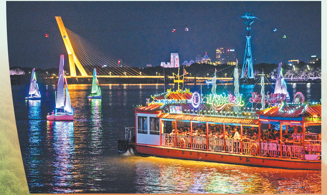
松花江上的夜游观光船。