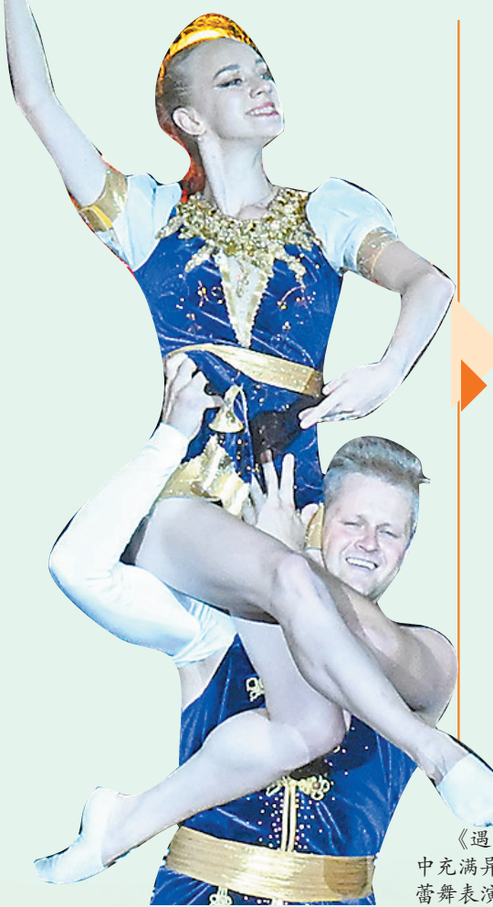
《遇见·哈尔滨》中充满异域风情的芭蕾舞表演。

夜幕下的松花江流光溢彩,《遇见·哈尔滨》大型江上沉浸式演出激情上演,观众沉浸在光影交织的“尔滨”式浪漫中;而在伊春,电音节强劲的节奏与松涛共鸣,年轻人随音符舞动……这些将是“欢腾龙江”文旅融合赋能行动打造的沉浸式文旅场景。 2025年黑龙江夏季避暑旅游“百日行动”期间,全省各地将积极拓展文旅新业态、新模式、新场景,举办第十五届中俄文化大集、第三届中国·哈尔滨之夏艺术节、第37届中国·哈尔滨之夏音乐会、第23届哈尔滨国际啤酒节等500多场特色文旅活动,让四海宾朋在沉浸式演出、大感元宇宙、AR历史街区、城市旅拍、芬多精森林浴等新业态项目中,深度感受黑龙江地域文化的魅力。 同时,通过“臻味龙江”烟火寻鲜逛吃行动,打造龙江特色餐饮体系,开展“跟着影视去旅游·品美食”活动,深度开发地标美食;通过“雅居龙江”住宿品质保障行动,发展高端品牌酒店和特色民宿,丰富内涵、提升服务;通过“潮游龙江”文旅消费焕新行动,推动“龙江好物”品牌提升和市场拓展,拓宽俄罗斯商品销售渠道,优化产品创意设计水平,加大惠民力度。