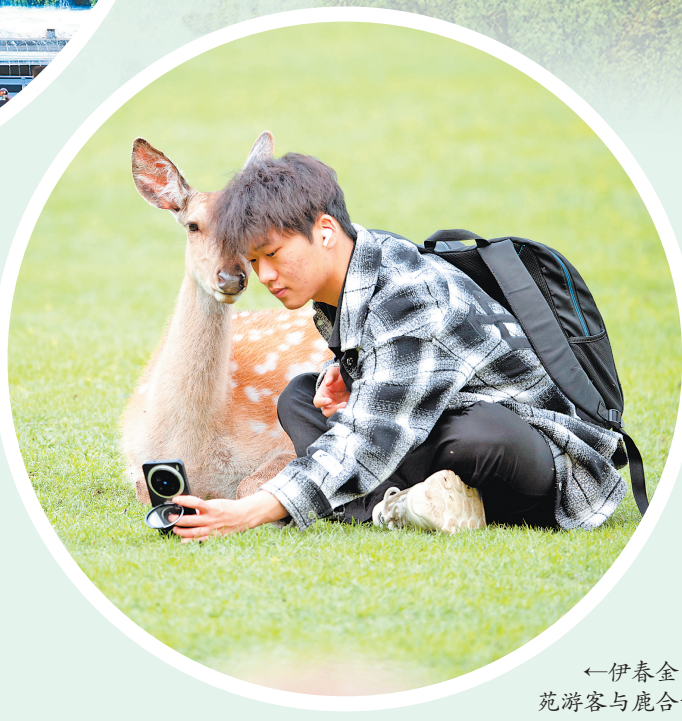
伊春金山鹿苑游客与鹿合影。