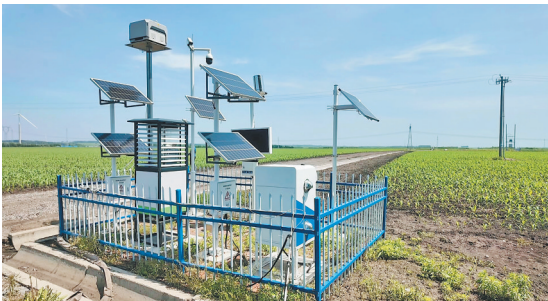
宝田村水稻现代农业科技示范基地