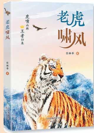
《老虎啸风》/任林举/新蕾出版社/2025年6月

啸风开始带领四只虎崽进入实战状态。最重要的一课,也是最难过的一关,它们都还没有“及格”,那就是耐心。啸风并没有责怪他们,它的耐心再一次显现出来。在小虎们能够独自狩猎之前,啸风是不会离开他们的。它能做的就是让孩子们向它学习,不断地模仿和尝