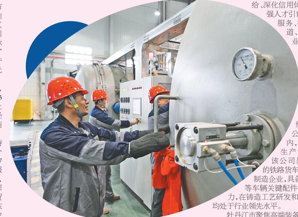
牡丹江一颗竹新材料公司高性能碳化硅陶瓷制品生产车间。