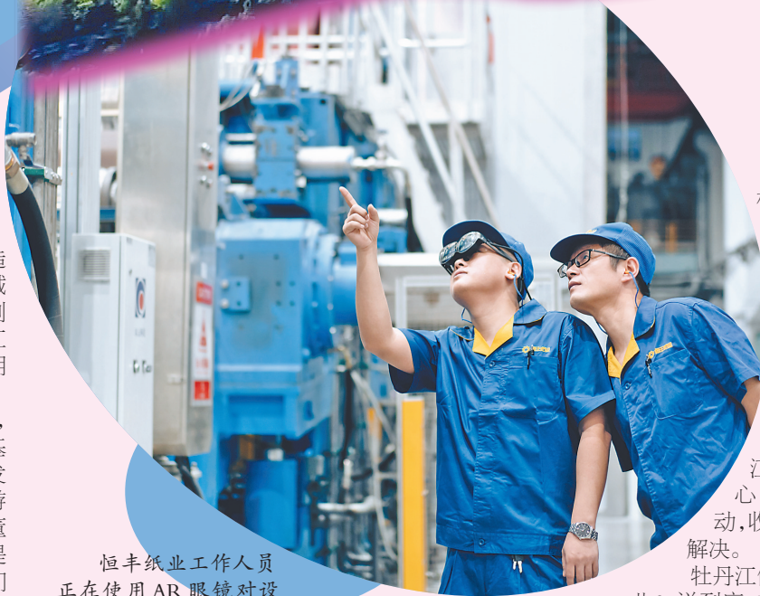
恒丰纸业工作人员正在使用AR眼镜对设备进行巡检。