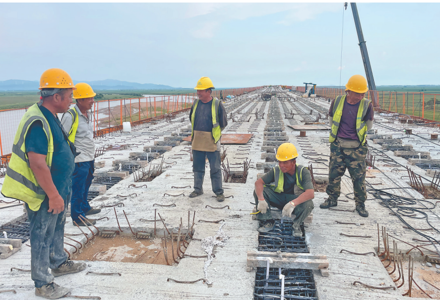
施工人员晒得黝黑。

的“黑色”爸爸,心疼得让妈妈买防晒霜。陈怀德跟女儿说,工地上的叔叔们都是“黑色”的,自己不能搞特殊化。