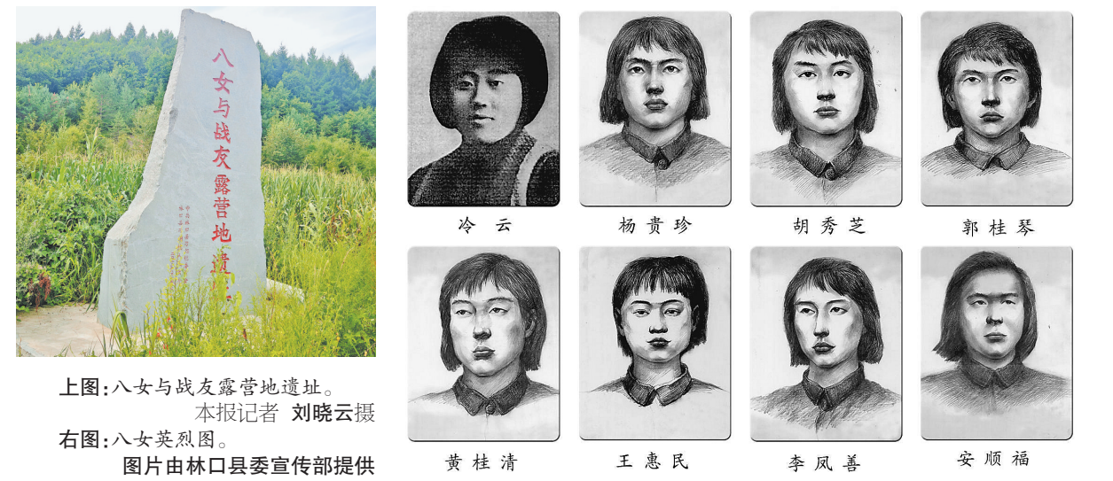
上图:八女与战友露营地遗址。 右图:八女英烈图。